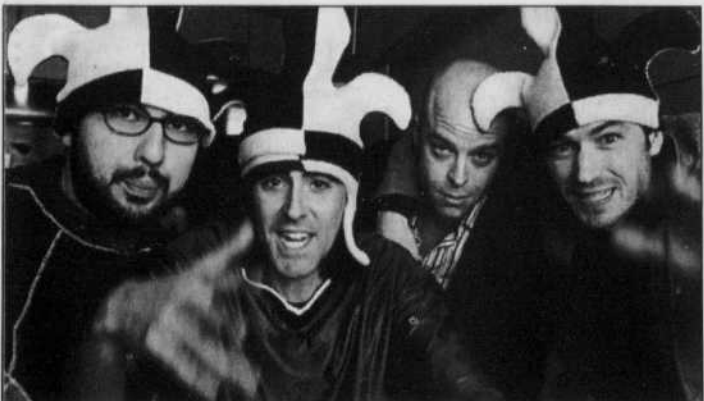
Le groupe Loco Locass sera de la fête à Montréal.