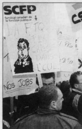
CLÉMENT ALLARD LE DEVOIR Les manifestations des syndicats de la fonction publique contre le gouvernement Charest ont repris de plus belle.

Si l'équité salariale est une des batailles gagnées, sa mise en ap-