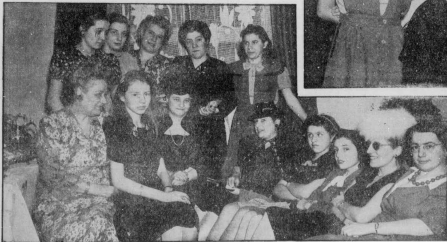
★ Voici les mamans qui accompagnaient leurs enfants à cette réception si bien réussie par Mme des Rameaux.