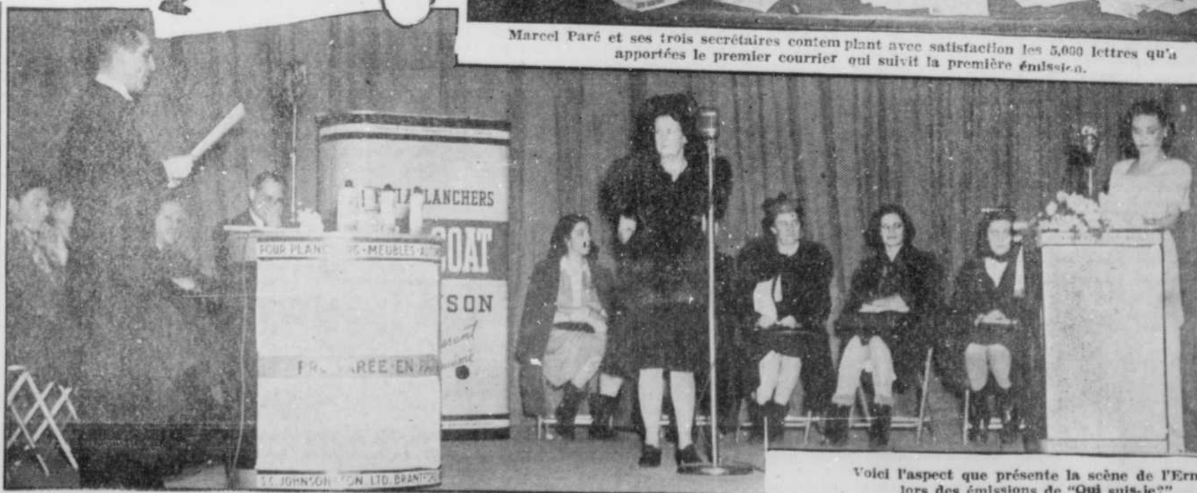
Voici l'aspect que présente la scène de l'Ermitage lors des émissions de "Qui suis-je?"