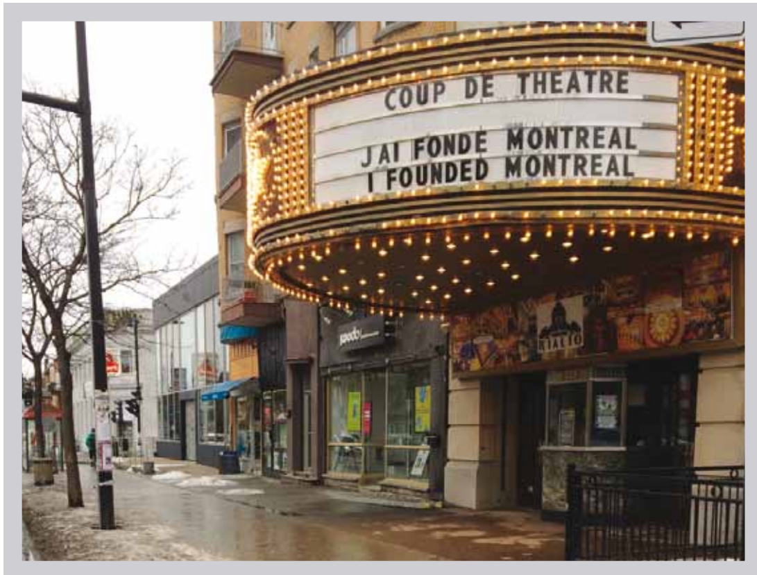
Séance photo pour l'exposition Coup de théâtre : J'ai fondé Montréal ! par la firme Umanium.

Après 18 mois de bon achalandage, l'exposition temporaire À leurs risques et périls – Voyager sur le continent autrefois a pris fin le 6 décembre 2016. Au cours de l'année, notre service a consacré beaucoup d'efforts pour proposer cette exposition en location, mais, à notre grand regret, notre offre n'a pas trouvé preneur. Cette expérience nous a néanmoins confirmé que la possibilité d'itinérance mérite d'être considérée lors de la conception des expositions temporaires.