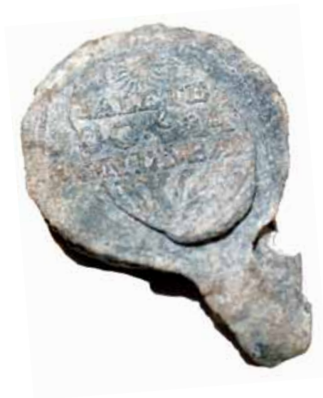
Plomb de scellé retrouvé sur le site de Bon-Secours et exposé en vitrine lors de la Tournée découverte 2016.

Offerte de juin à août 2016, ainsi que les fins de semaine de septembre et d'octobre, cette visite a connu une popularité croissante. Au total, 3 133 visiteurs y ont participé, ce qui constitue un record de fréquentation pour cette activité. De manière générale, les Tournées découvertes gagnent en popularité chaque été depuis 2012.