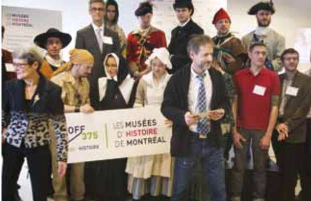
14 décembre 2016

En lien avec le 375 e anniversaire de la fondation de Montréal, une réflexion s'est poursuivie pour tenter de mettre de l'avant les expositions du Musée. Le service Communications et marketing profitera de cette occasion pour faire valoir la mission du Musée ainsi que la richesse de ses collections patrimoniales. Dès décembre 2016, nous avons pris part au lancement du OFF375 de Montréal, une initiative du Regroupement des musées d'histoire de Montréal.