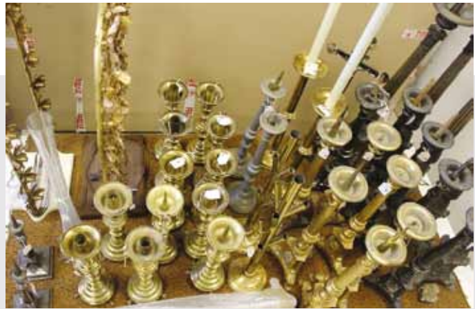
Chantier des collections au Séminaire de Saint-Sulpice, avril 2016.