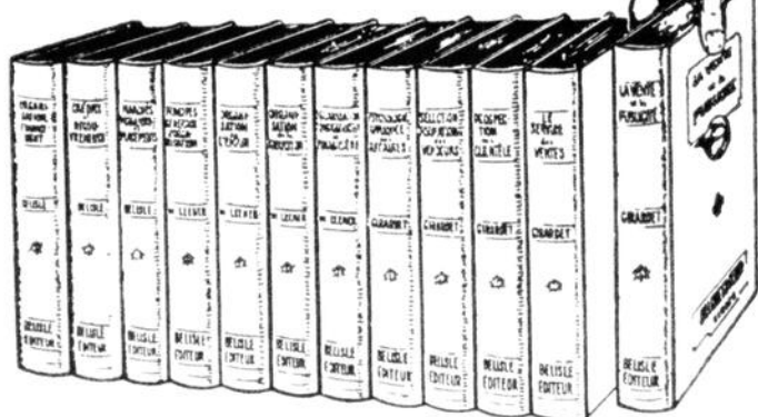
RELIURE BLEUE — TITRES DORES

Pour le propriétaire, le gérant ou les chefs de services