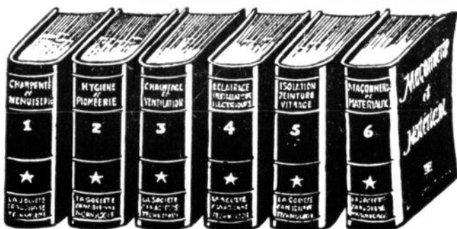
RELIURE ROUGE MANDARIN