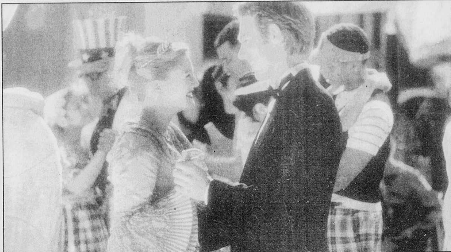
Au bal des finissants Josie Geller (Drew Barrymore), qui vient d'être couronnée la reine de la soirée partage une danse avec son professeur Sam Coulson (Michael Vartan) avant que n'éclate la vérité sur les véritables motifs de sa présence dans cette école.

Avoir l'opportunité de vivre une deuxième fois un épisode particulièrement horrible et douloureux de sa vie, en l'occurrence une adolescence houleuse et, grâce à l'assurance acquise depuis, trouver enfin sa douce revanche.