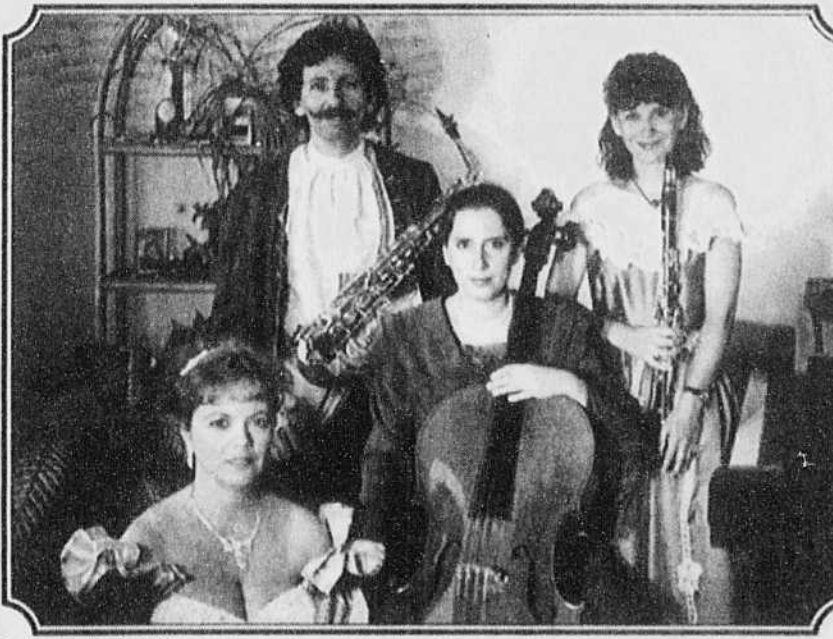
Quatuor La Cambiata

«De plus, le Festival du lac Massawippi va aider le nouveau Festival de Saint-Zénon-de-Piopolis, qui débute cette année. On leur donne un soutien financier et technique; on crée ainsi un réseau», dit-il.