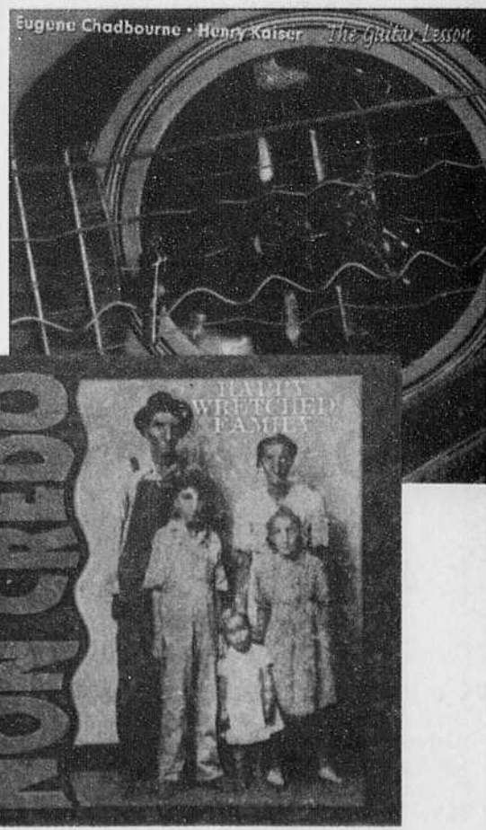
Deux des nombreuses pochettes de disques imaginées et réalisées par Bienvenue: Eugène Chadbourne/Henry Kaiser, «The guitar lesson», Disques Vivo, 1999 (montage de la guitare, photo et typographie) et les Happy Wretched Family, «Non Credo», Disques Victo, 1995. (photomontage et typographie)

Un entretien chaleureux avec Rachel Lussier à lire en Page 66.