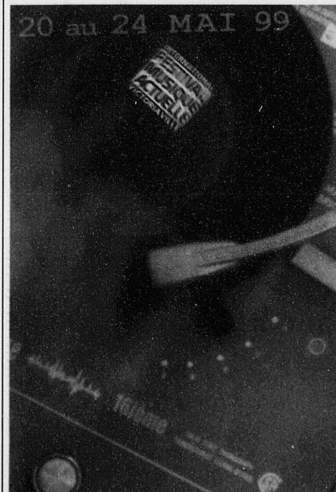
En primeur, l'affiche de l'édition 1999 du Festival de musique actuelle de Victoriaville. Une oeuvre de François Bienvenue qui en a créé 16 sur 16 pour cet événement qui a vu le jour en 1983. (photo, photomontage et typographie)

Et, mis au courant du dernier mode de financement de l'OSS pour combler son déficit: «Achetez-en, des notes de la 5e de Beethoven!»