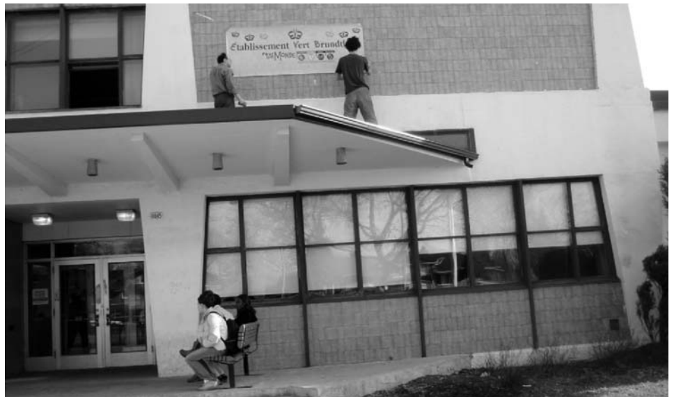
Installation de la banderole EVB à l'extérieur de l'école.

Naturellement, aux dires de plusieurs, cette journée fut un franc succès! Tous s'entendent pour affirmer que c'est une expérience à revivre d'autant plus que les jeunes et le personnel de l'école sont