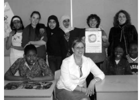
Le comité EVB de l'école Évangéline.

D'autres ateliers furent animés par certains profs de l'école Évangéline. On y présentait, entre autres, un film sur le merle d'Amérique, on y débattait d'O.G.M. et de bien d'autres thèmes