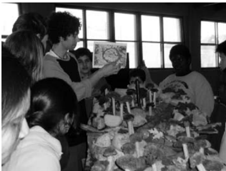
Des élèves de l'école vers la fin de la confection de leur fontaine.