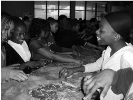
Des élèves de l'école au début de la confection de leur fontaine.

Lundi, le 19 avril, se tenait à l'école Évangéline une journée atelier durant laquelle les élèves étaient invités à voir différents kiosques et à participer à différents ateliers qui traitaient de thèmes environnementaux en collaboration avec le comité EVB de l'école. Plusieurs invités, spécialistes dans leur domaine, se sont joints aux différents ateliers pour le plaisir et le bénéfice de tous.