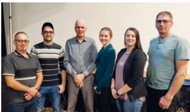
Les trois entreprises qui ont participé au panel.

Le panel a été un volet particulièrement apprécié de l'AGA. En effet, trois duos composés d'un producteur agricole et sa relève (étalée ou non) se sont prêtés au jeu. La thématique choisie était l'adaptation des fermes, au cours des dernières années, aux pressions sociétales, économiques et environnementales pour permettre aux jeunes de reprendre les entreprises. Merci aux Bergeries du Margot, de Bonaventure, à la Bergerie Patapédia, de l'Ascension-de-Patapédia, ainsi qu'à la Ferme Bel-Horizon, de Matapédia, pour leur participation. ✕