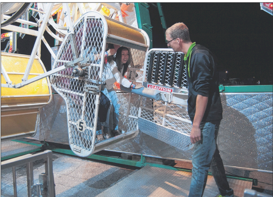
Le Zipper est l'un des manèges les plus connus du festival. Quiconque aime les sensations fortes se doit de l'essayer au moins une fois.