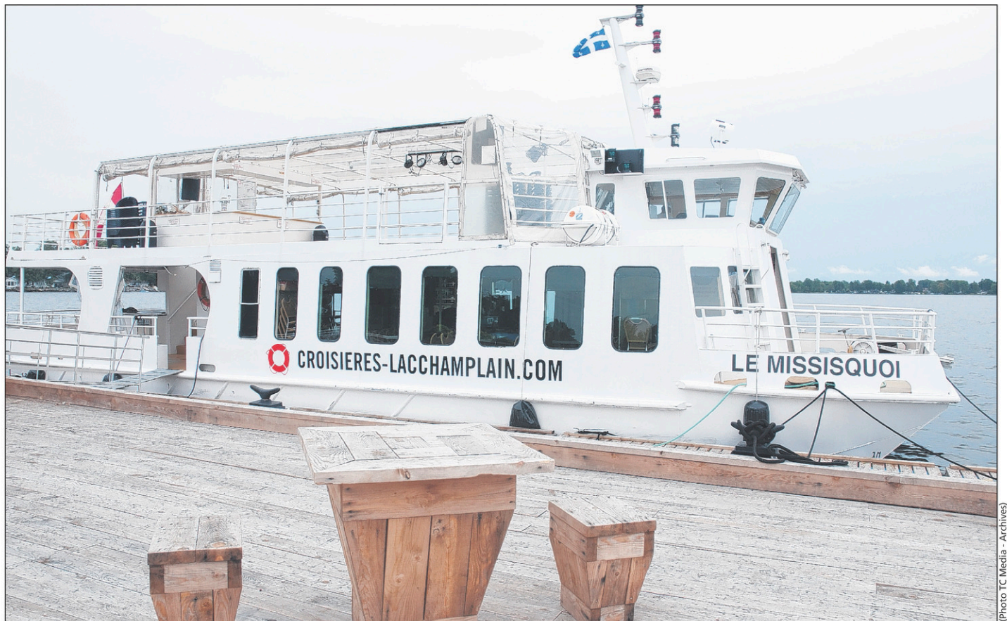
Le consortium d'actionnaires du Centre de villégiature Venise-sur-le-Lac veut alléger son implication. Les Croisières du lac Champlain sont entre autres à vendre.

villégiature confie que les opérations, autant pour les croisières que pour les restaurants, sont très profitables. Il estime toutefois qu'elles le seront encore plus une fois séparées de l'Auberge et de La Marina.