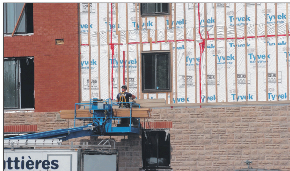
La construction de condos est en chute libre à Saint-Jean-sur-Richelieu en 2015.

La SCHL estime encore que la deuxième moitié d'année devrait être plus favorable à la construction résidentielle, notamment en raison de l'envol d'un secteur bien spécifique.