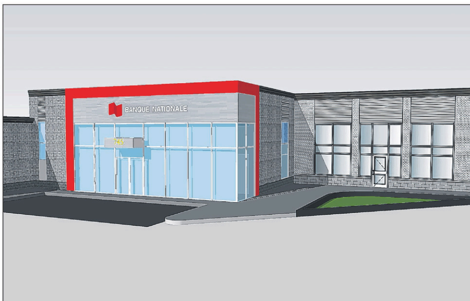
La Banque Nationale sera située à côté de la garderie Odyssee II.

La Banque Nationale sera la dernière réalisation du Carré Singer, un projet qui