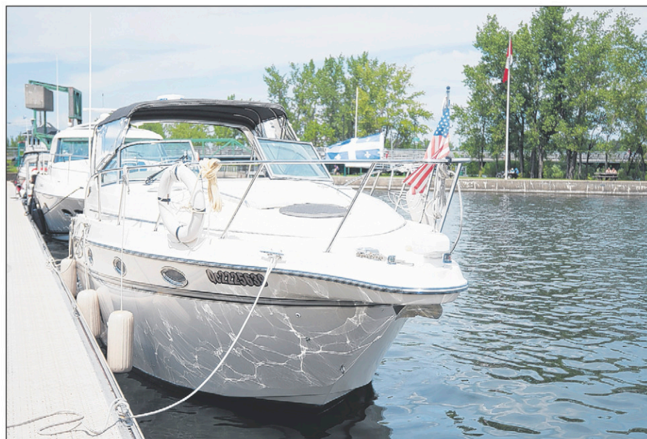
Malgré un taux de change à leur avantage, les Américains sont moins nombreux que l'an dernier à franchir les écluses du canal de Chambly.

Sans surprise, les employés ont aussi compté moins de visiteurs à bord de ces