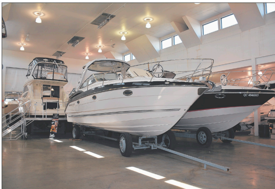
Les bateaux ont beaucoup grossi depuis les premières années de la Marina Fortin.

tous ses clients, M. Fortin s'est procuré une grue permettant de sortir de l'eau des bateaux d'un poids de 50 tonnes.