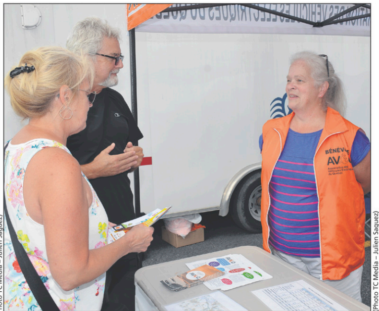
Les gens ont été nombreux à demander des informations sur les véhicules électriques.