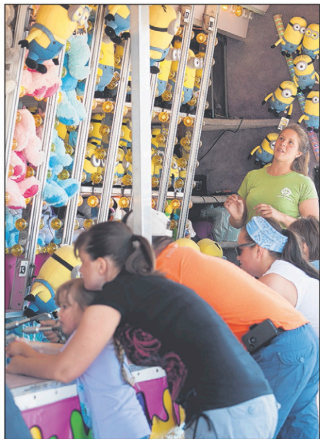
Bien des festivaliers ont tenté leur chance dans les jeux afin de remporter des toutous à l'effigie des Minions.