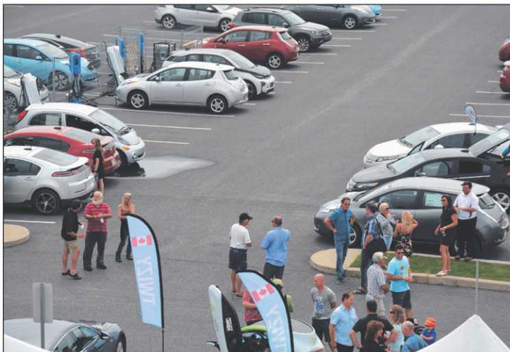
Environ 70 propriétaires de voitures électriques ont participé à l'événement, samedi, au terminus d'autobus.