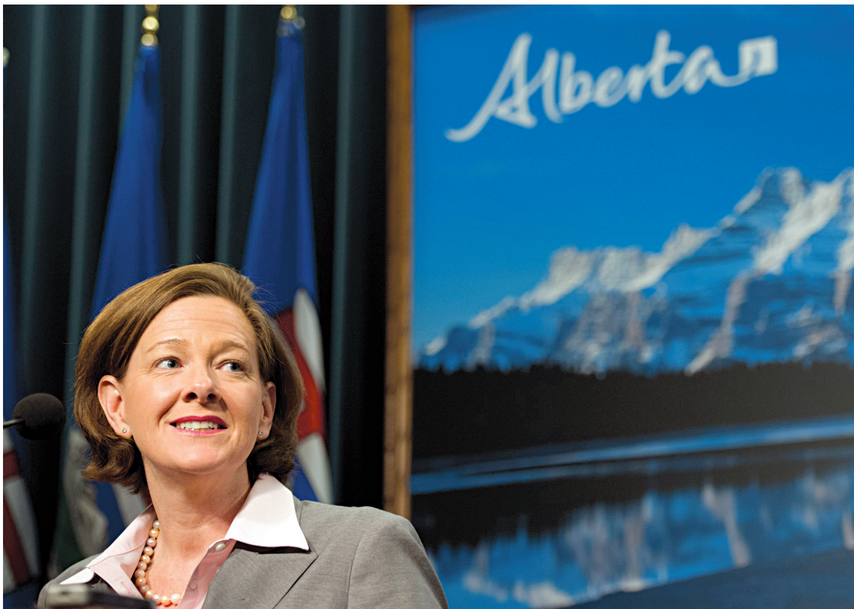
Alison Redford, première ministre de l'Alberta