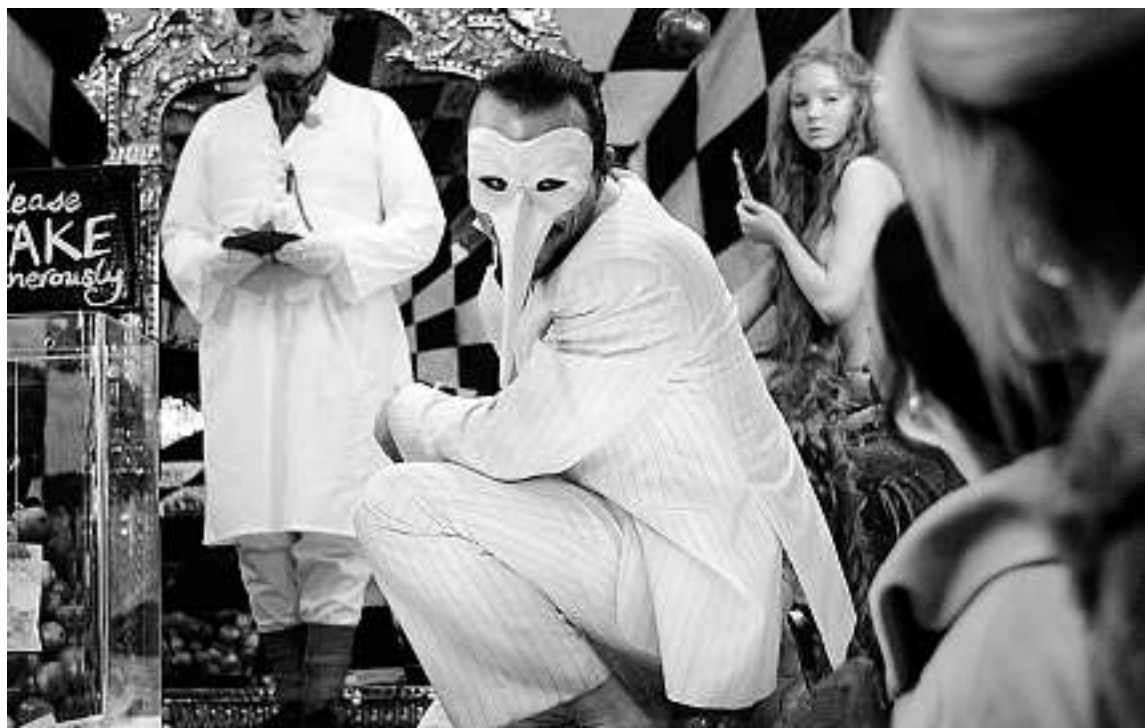
The Imaginarium of Dr Parnassus