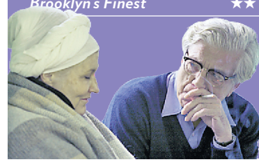
Les signes vitaux

JOSIANE BALASKO LA SORTIE DU BOCAL PAGE 6