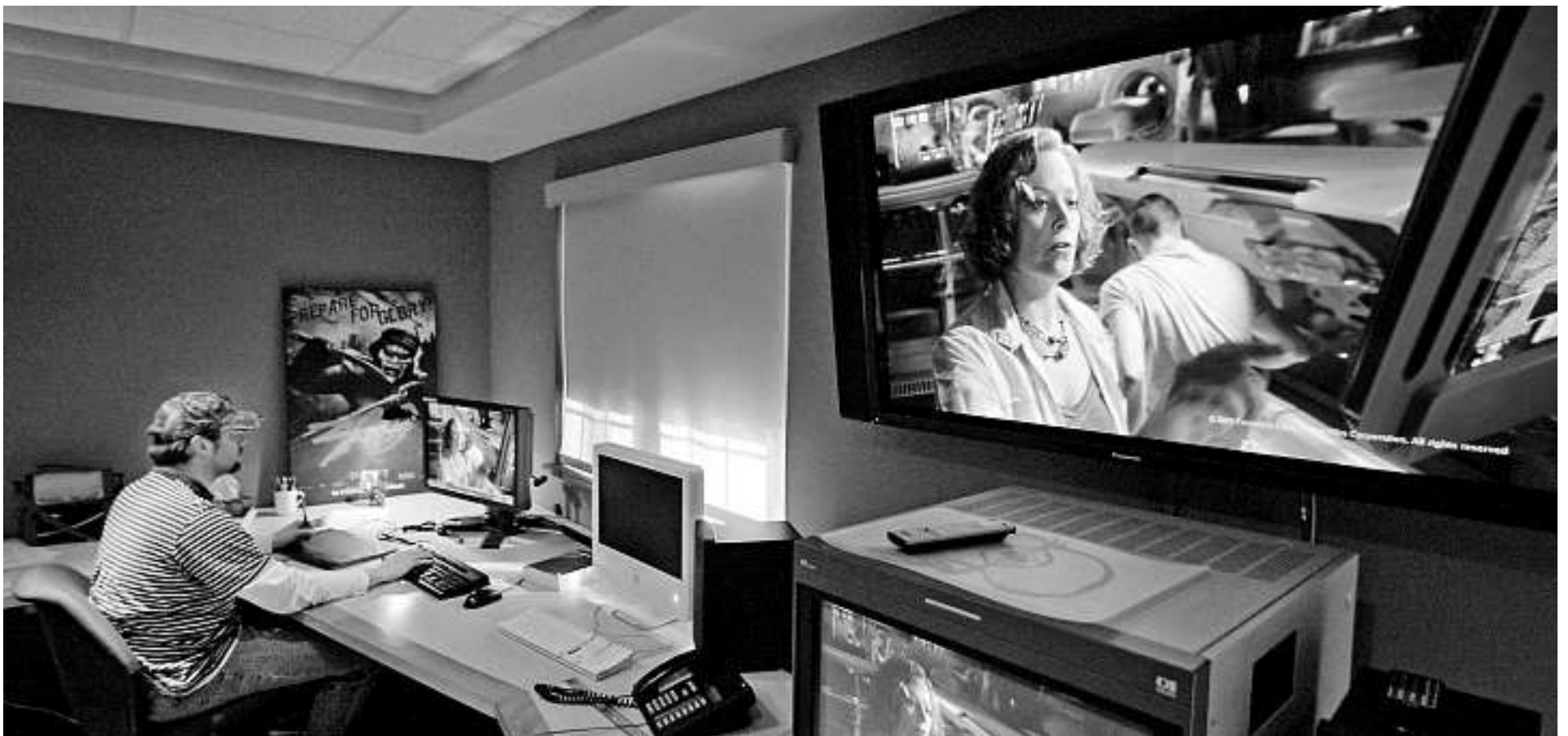
C'est dans une maison de Piedmont que le personnel d'Hybride a créé le link room d'Avatar, salle où les scientifiques s'installent pour rejoindre leur avatar.