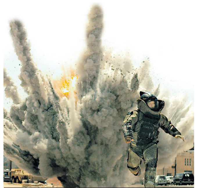
The Hurt Locker

PRÉDICTION: L'effet Avatar s'étant amenuisé au cours du dernier mois, The Hurt Locker repartira avec l'ultime statuette. Mais ce sera très serré.