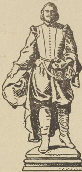
"Il a apporté au Canada la pensée française et la civilisation."

Cie Chimique FRANCO Américaine Ltée, 1566 rue St-Denis, Montréal.