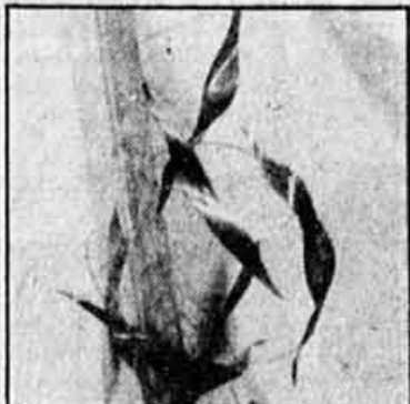
Oeuvre de Jean Noël

Il en présente une dizaine de ces objets à la galerie Michel Tétrault. Faits de pièces de bois léger aux allures de boomerang et de morceaux ondulés de fibre de verre, de vynille ou de tissu, ils sont conçus pour être accrochés aux murs par un point très précis et savamment calculé qui leur donne une dynamique mystérieuse.