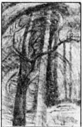
Emily Carr. Huile sur papier 18" x 12"

EXPOSITION PRÉLIMINAIRE: Vendredi 14 juin de 12 h à 22 h. Samedi 15 juin de 10 h à 18 h. Dimanche 16 juin de 10 h à 18 h. Lundi 17 juin de 12 h à 22 h. VENTE: Mardi 18 juin à 19 h 30 précises: art canadien et européen. Mercredi 19 juin à 19 h 30 précises: mobilier, antiquités et objets de collection