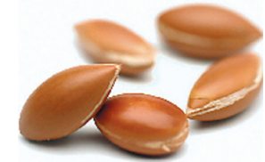
Les amandons d'argan sont torréfiés moulus et pressés pour en extraire l'huile d'argan alimentaire.

Elle est de plus utilisée chez les nourrissons et les bébés berbères pour effectuer les mas-