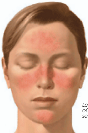
Les zones du visage où la rosacée se produit

L'hygiène, pour sa part, est rarement en cause, sauf de rares exceptions. Anciennement, on recommandait aux victimes de l'acné de se laver le visage plusieurs fois par jour avec des savons abrasifs. Tel n'est plus le cas. On conseille maintenant de se laver le visage deux fois par jour en utilisant un savon ou un nettoyant très doux pour éviter d'irriter la peau.