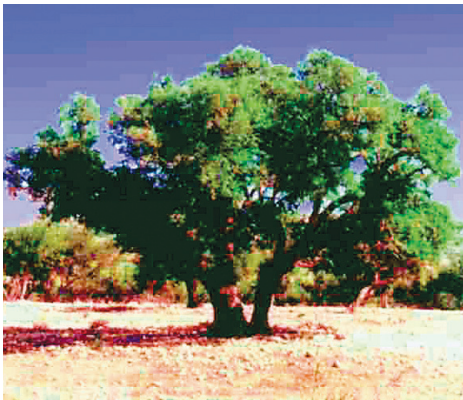
L'arganier provient du Maroc

Deux fruits de la nature se révèlent excellents pour les soins de la peau, tant leur composition est riche en éléments essentiels. Ce sont l'huile d'argan et la baie d'argousier, la première provenant du Maroc, la seconde étant cultivée au Québec.