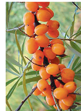
Les baies de l'argousier au goût acidulé sont très riches en vitamines C, E, A, B1, B2, F, K et P.

En soin anti-âge, l'huile d'argan adoucit la peau, l'hydrate et la protège contre le dessèchement. Elle permet aussi d'allier le plaisir sensuel du massage aux bienfaits de la vitamine E, en massage corporel pour hydrater, nourrir, assouplir la peau après le bain ou la douche. L'huile d'argan est utilisée aussi pour les coups de soleil superficiels et les peaux irritées. Elle est également recommandée pour les soins des ongles cassants et dédoublés qu'elle fortifie et protège contre les agressions extérieures. En traitement capillaire, pour les cheveux secs, ternes et cassants, l'huile d'argan donne éclat et brillance.