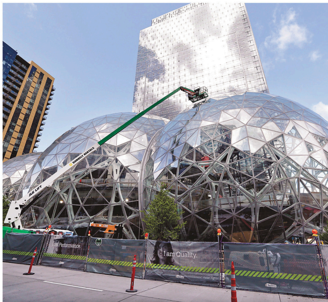
Le campus Amazon, au centre-ville de Seattle