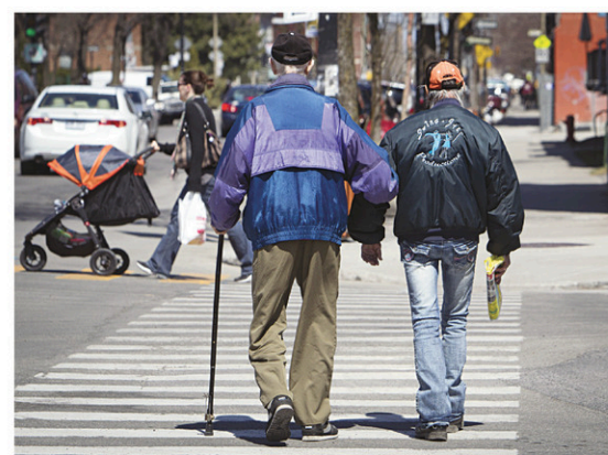
ANNIK MH DE CARUFEL LE DEVOIR

Pour la première fois depuis au moins un siècle, les nouvelles générations ne peuvent pas compter sur une augmentation de leurs reve-