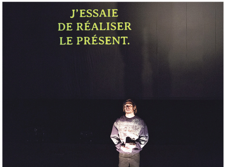
Mélancolique, pour ne pas dire hantée, l'œuvre, éminemment plastique, flirte avec l'installation et la performance.