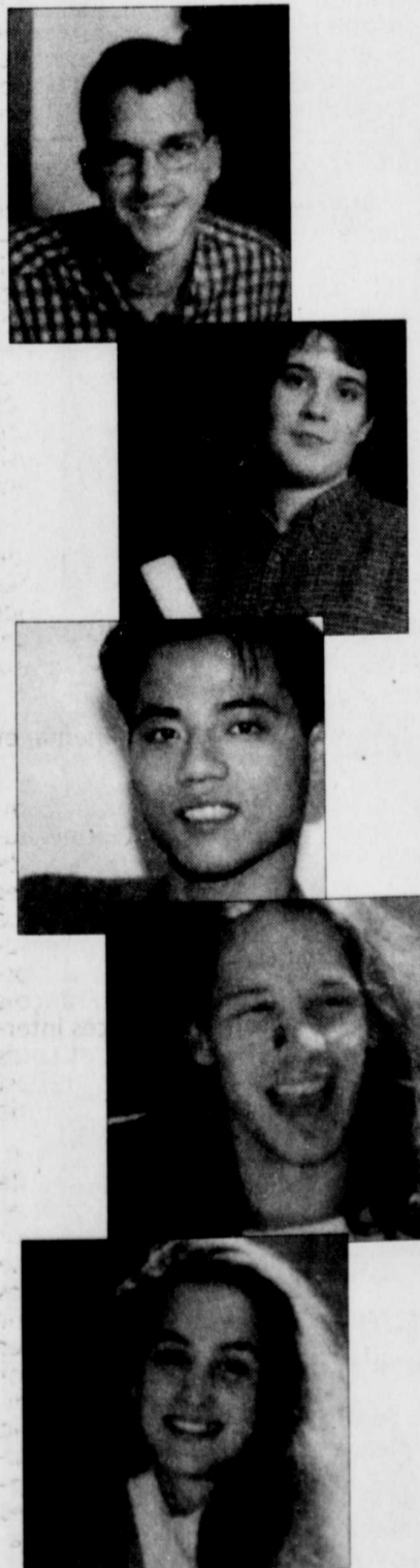
Le savoir, source de liberté...

Service aux entreprises 7600, 3 e Avenue Est, Charlesbourg (Québec) se@climoilou.qc.ca