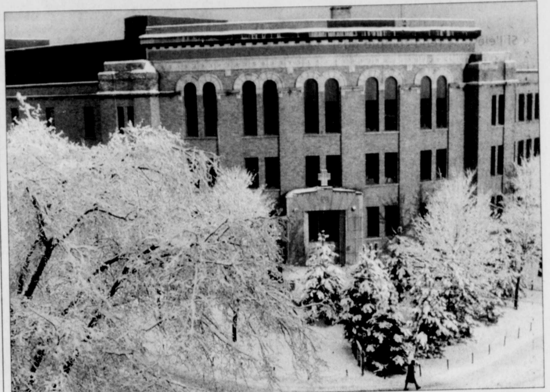
Le Cégep de Limoilou accueille près de 5000 étudiants à l'enseignement régulier au Campus de Québec. Plus de 3000 adultes y poursuivent aussi des études collégiales en étant inscrits aux programmes offerts par la Formation continue.