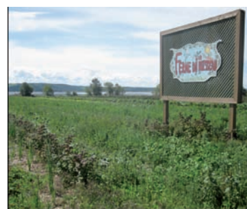
Figure 1: Un des signes évidents de cultures particulières et de vente à la ferme à Saint-Fulgence (Majella-J. Gauthier).

On sait maintenant que la municipalité de Saint-Fulgence va s'impliquer dans le projet de recherche. Elle ne peut y échapper. Elle a comme un devoir de découverte et une mission de mise en valeur originale de son territoire. De plus, la recherche permettra de développer un outil utilisable dans d'autres localités et d'autres régions. C'est à suivre.