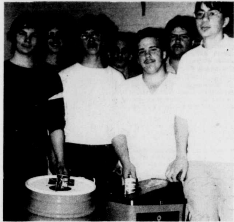
Un groupe d'étudiants montre le prototype fait à l'école et le récupérateur de cannettes.

Par ailleurs, les 1.000 $ de revenus générés par le retour des cannettes ont été versés par les étudiants à un projet humanitaire en Haïti. Pour ce don, l'Association canadienne de développement international (ACDI) doit ajouter 3.000 $ dans le projet concerné.