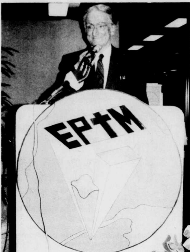
Le ministre de l'Éducation, Claude Ryan, a donné un appui sans réserve à la cause défendue par le Groupe Poly Plus de l'école polyvalente de Thetford-Mines.

Le ministre de l'Éducation affirme que l'école doit être un milieu