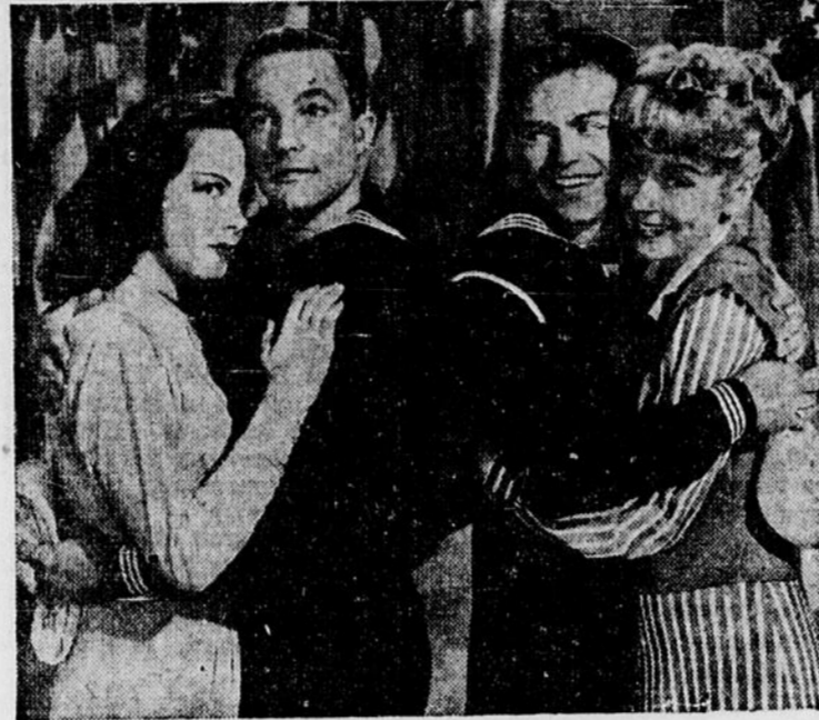
Gene Kelly, Kathryn Grayson et Frank Sinatra sont les étoiles principales du grand succès musical en couleurs naturelles "ANCHORS AWEIGH", qui sera à l'affiche au théâtre Cartier dimanche, lundi et mardi, ainsi que pour la représentation spéciale de la Veille du Jour de l'An. L'attraction supplémentaire "GETTIN' GLAMOUR" plaira certainement aux dames.

"PRIDE OF THE MARINE" Bon film qui raconte l'histoire d'un héros des fusiliers de la marine américaine. Al Schmid... Celui-ci devint amoureux juste avant Pearl-Harbor, mais s'enrôla à la déclaration de la guerre. A Guadaleanal, il abattit à la mitrailleuse plus de 200 japonais avant d'être atteint par une grenade qui l'aveugla. Après une opération qui ne lui rendit pas la vue, il faillit d'abord s'abandonner au désespoir et voulut rompre avec sa fiancée mais celle-ci lui resta fidèle et il reprit courage. Cette production émouvante constitue une belle leçon de courage. John Garfield est à son mieux, avec le concours d'Eleanor Parker. (Adultes.)