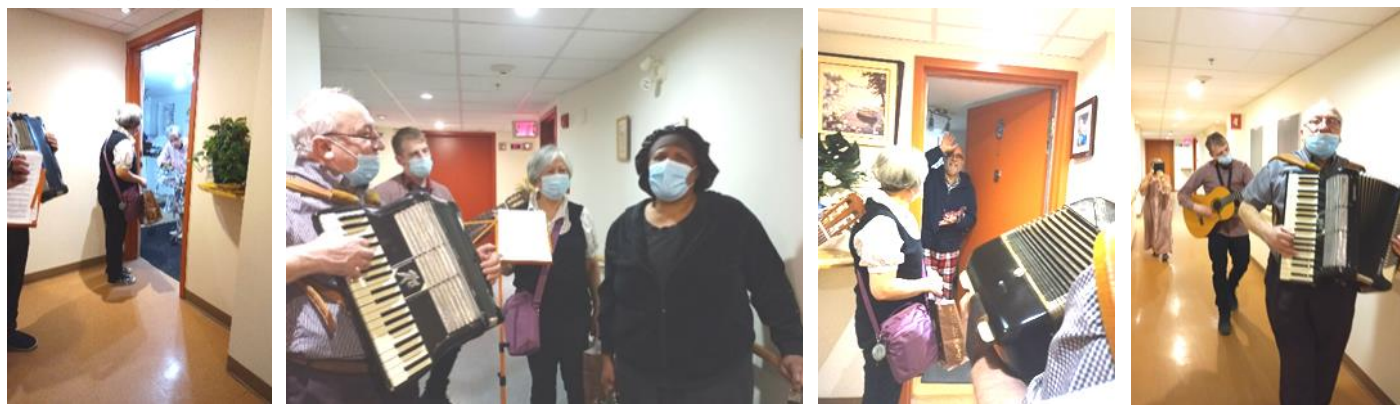
« Parade de corridor » à la St-Valentin, OSBL Maison Côte-Sainte-Catherine .

Après avoir passé l'hiver confiné et restreint à peu de contacts, nos aînés commencent la nouvelle année avec une « parade de corridor » à la St-Valentin dans l'OSBL d'habitation Maison Côte-Sainte-Catherine . Cette visite musicale a réchauffé leur cœur, puis a satisfait leurs papilles avec la distribution de chocolat.