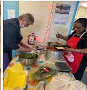
Préparations et dégustation, HLM Goyer