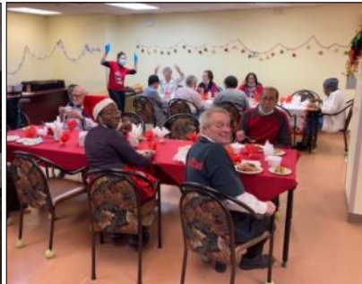
OSBL Maison Côte-Ste-Catherine