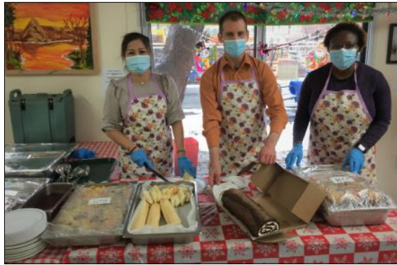
Les intervenants de milieu en action, HLM CDN