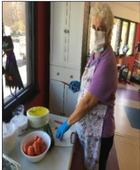
Visite du directeur, HLM Plamondon