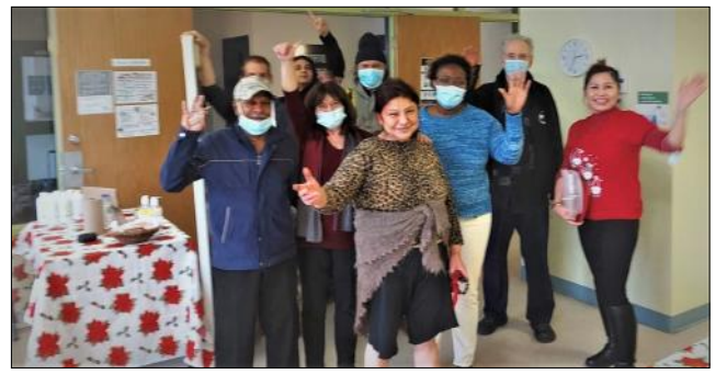
Heureux de se revoir, HLM Bourret