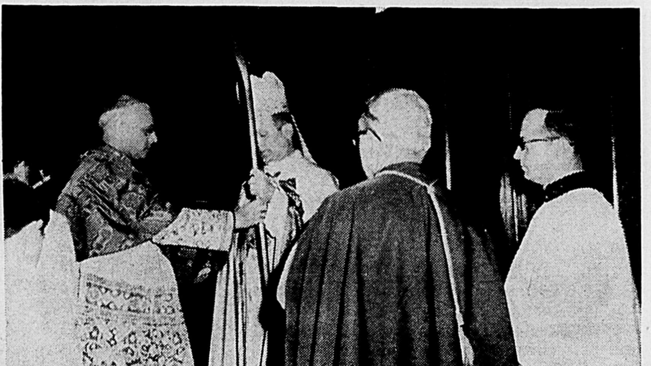
REÇOIS CE BATON PASTORAL, SIGNE DE TON OFFICE DE PASTEUR" — C'est en prononçant ces paroles que S.E. le Délégué Apostolique remet au nouvel évêque la canne du berger, symbole de son rôle auprès de la portion du