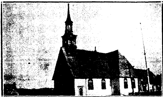
L'église de Saint-Pierre