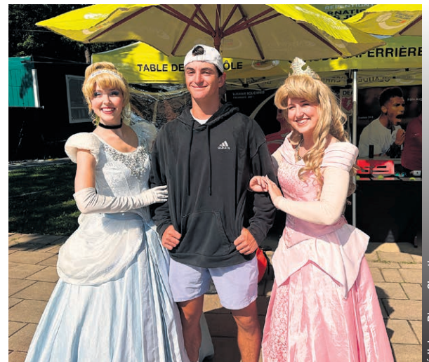
L'ambiance était festive et même les joueurs ont eu du plaisir.

Plusieurs entreprises et organismes communautaires ont profité de l'occasion pour faire la promotion de leurs différents produits et services destinés au bien-être, santé et prévention des familles. Tout au long de la journée qui se terminait à 15h. Plusieurs tirages ont permis de faire des heureux parmi les familles participantes. Tradition oblige: le dîner hot-dog à 3 $ s'est avéré fort populaire pour le plus grand plaisir des petits et grands.