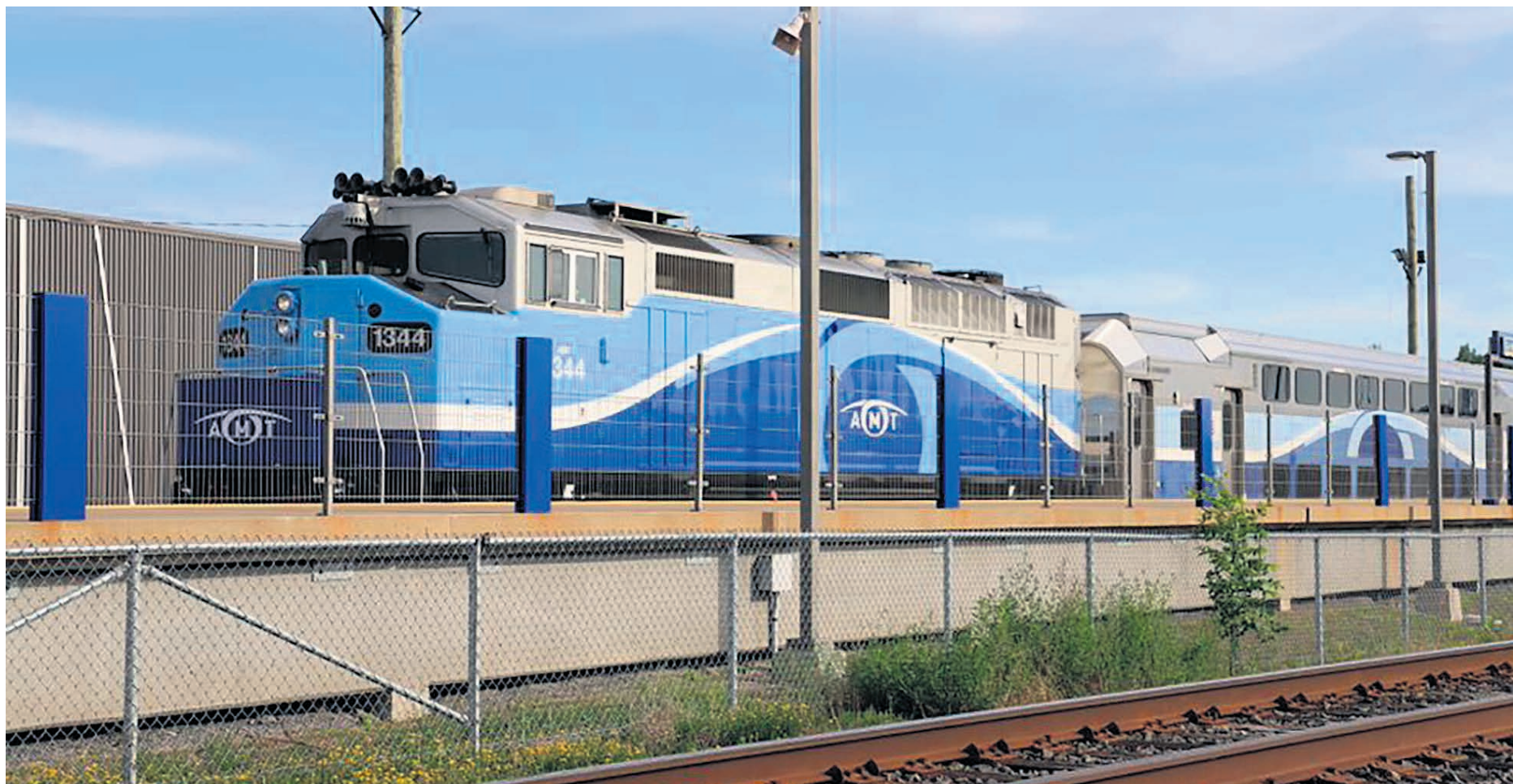
La résolution adoptée par les élus exige notamment un financement stable et prévisible du transport en commun.