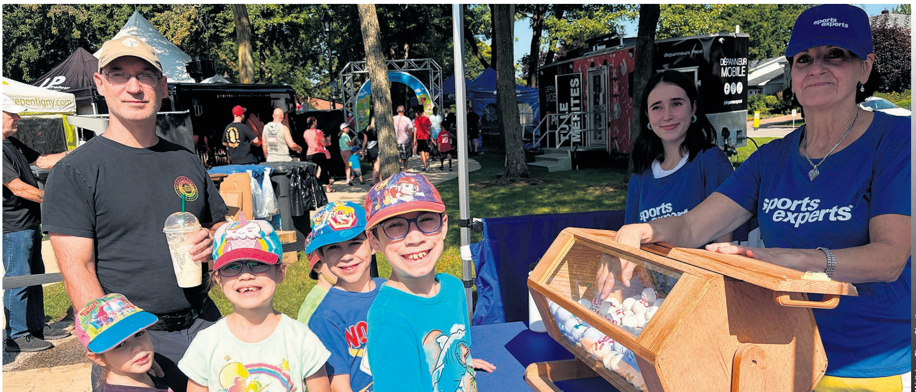
Les enfants avaient l'embarras du choix: le kiosque de Sports Experts a été apprécié.