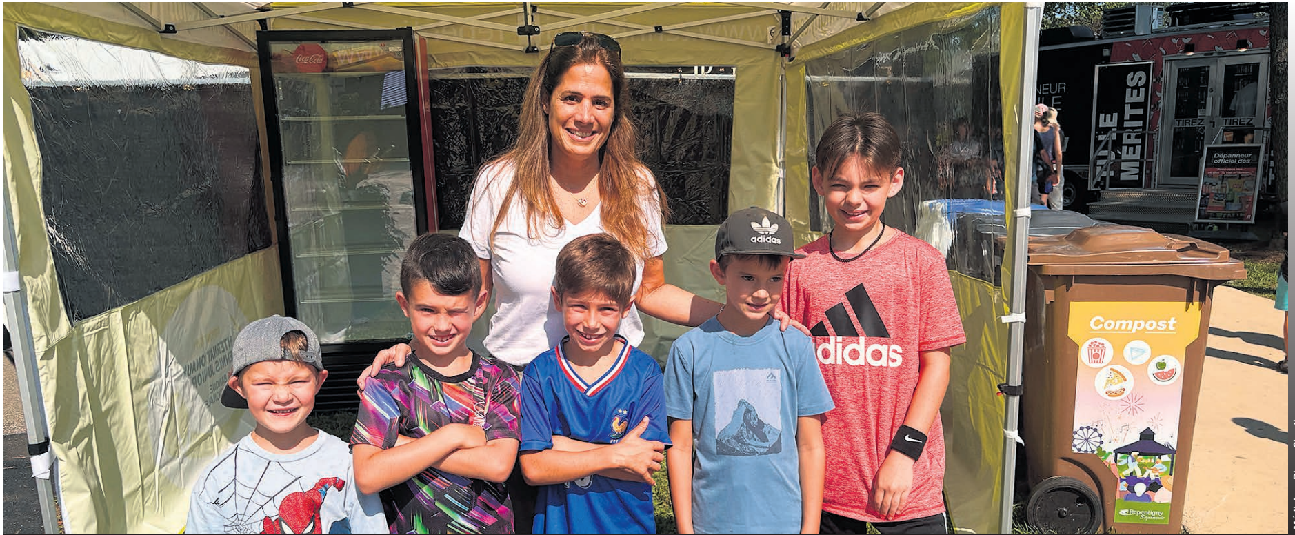
Beaucoup d'ambiance lors de cette Journée de la famille.