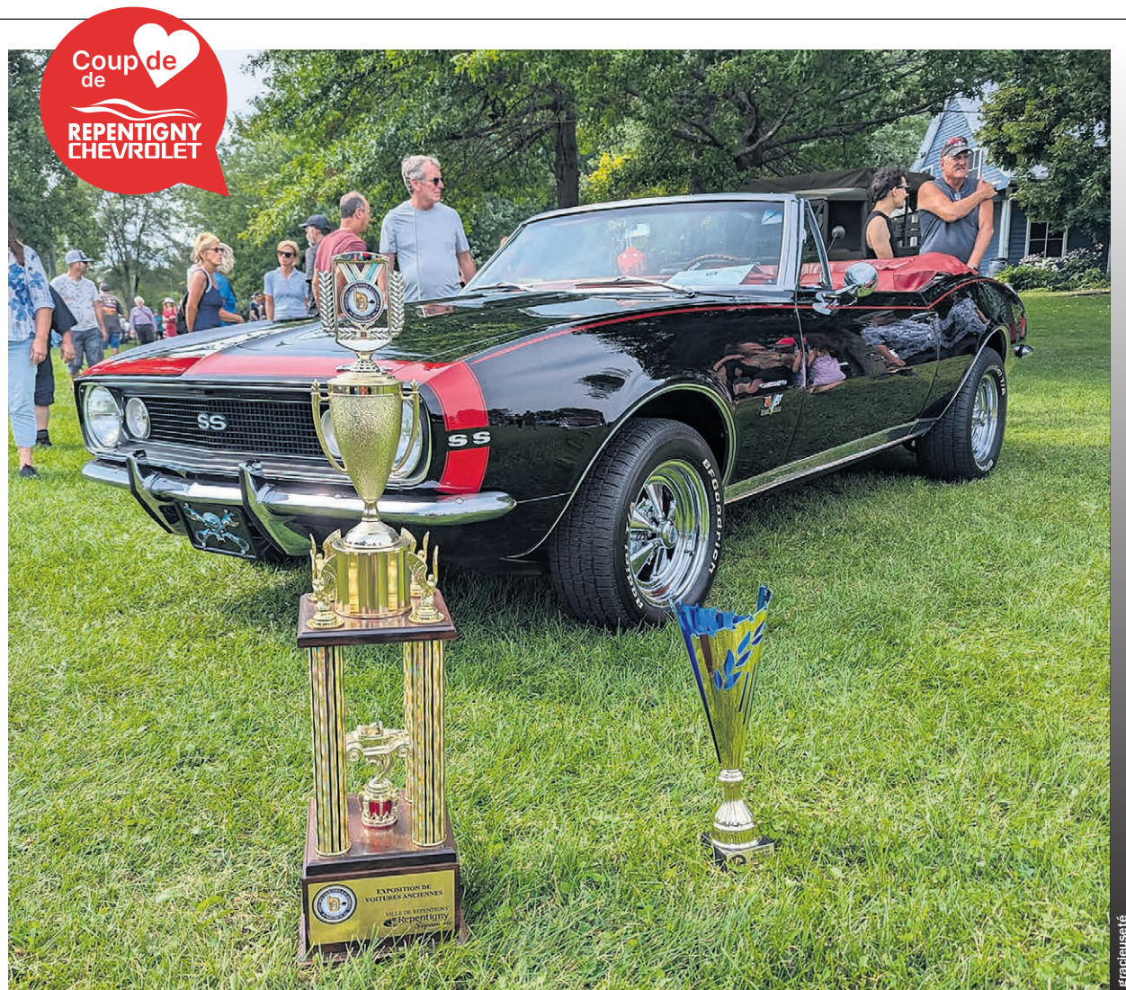
Plusieurs personnes ont assisté à la présentation des belles d'autrefois.

Depuis plus de 68 ans, le Club de Voitures Anciennes et Classiques de Montréal (VACM) joue un rôle clé dans la préservation de l'histoire automobile au Québec. En tant que plus ancien club de voitures anciennes de la province, le VACM est un fervent défenseur du patrimoine automobile québécois. Il organise régulièrement d'importantes expositions, dont celles de Boucherville, Lachine, Terrebonne et Repentigny. (PC)