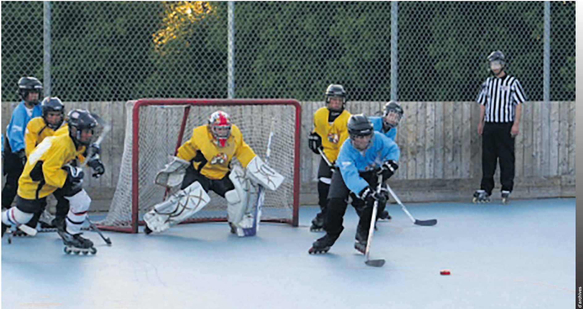
Le jeu est autorisé dans certaines rues à Repentigny.