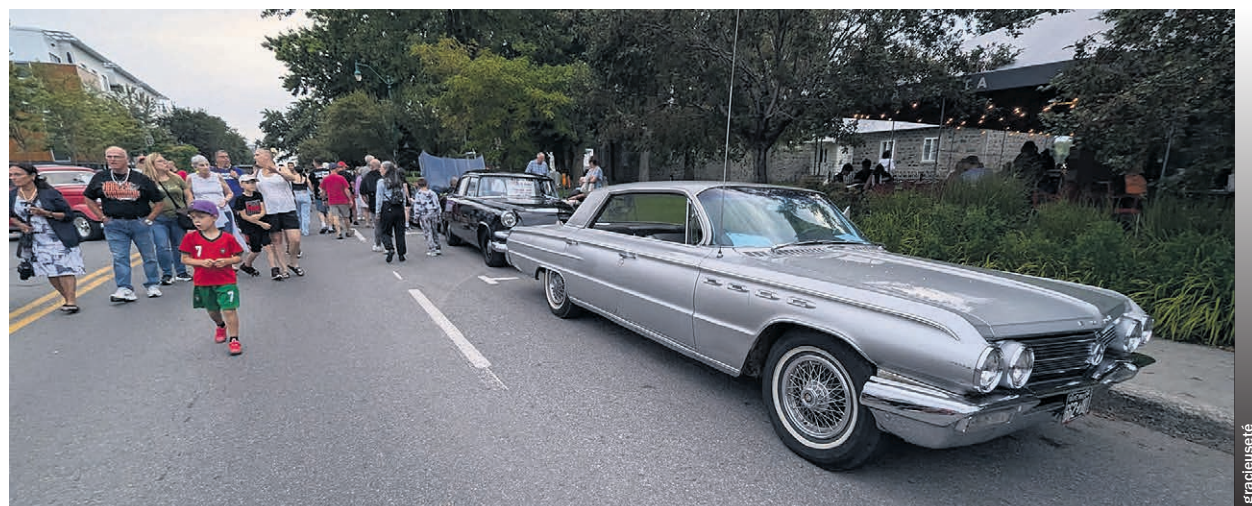
Plusieurs prix ont été remis lors de l'exposition.