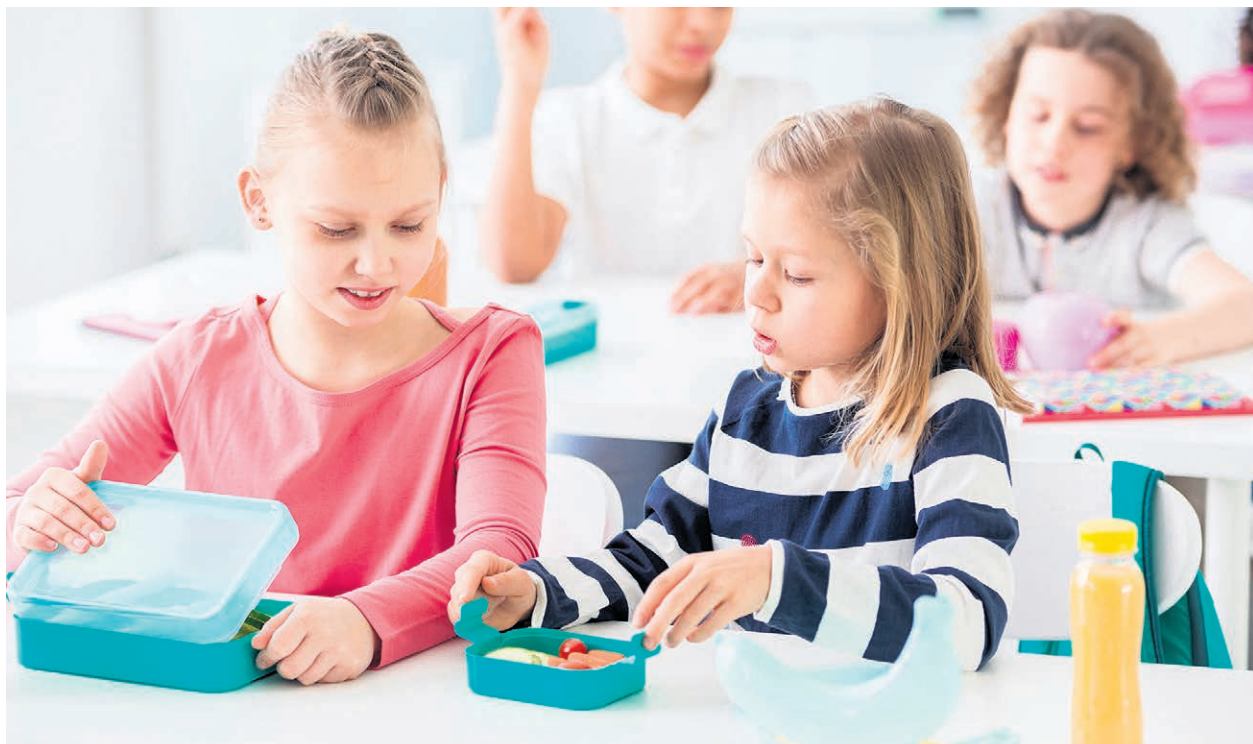
Les contenants réutilisables sont essentiels pour une boîte à lunch écologique.