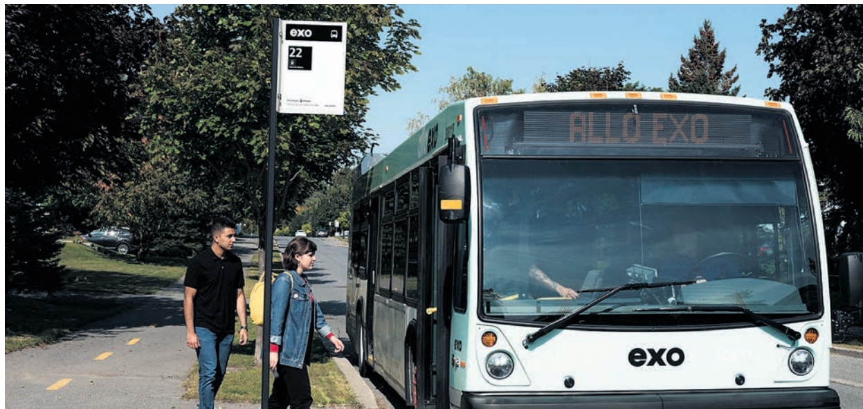
Plusieurs modifications à l'horaire des autobus d'exo entreront en vigueur le 19 août.

Ainsi, la clientèle est invitée à planifier ses déplacements au moyen de l'application Chrono, notamment en activant les alertes perturbations pour leurs lignes favorites.