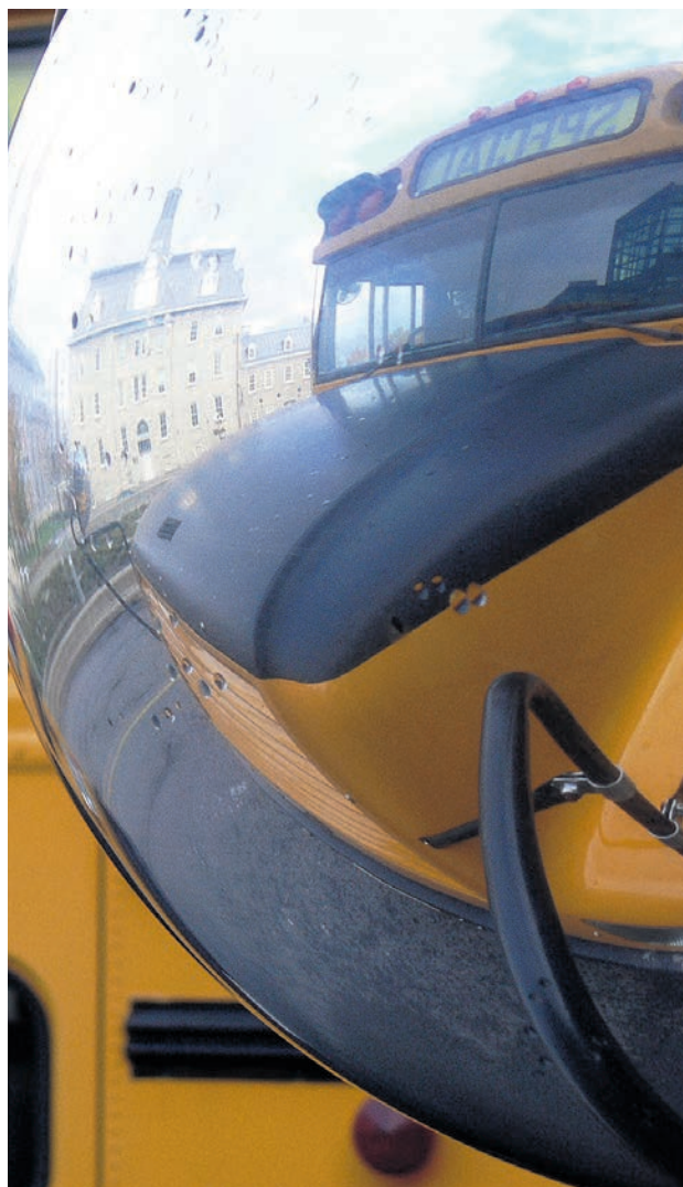
La rigueur est de mise lors du croisement d'un autobus scolaire.