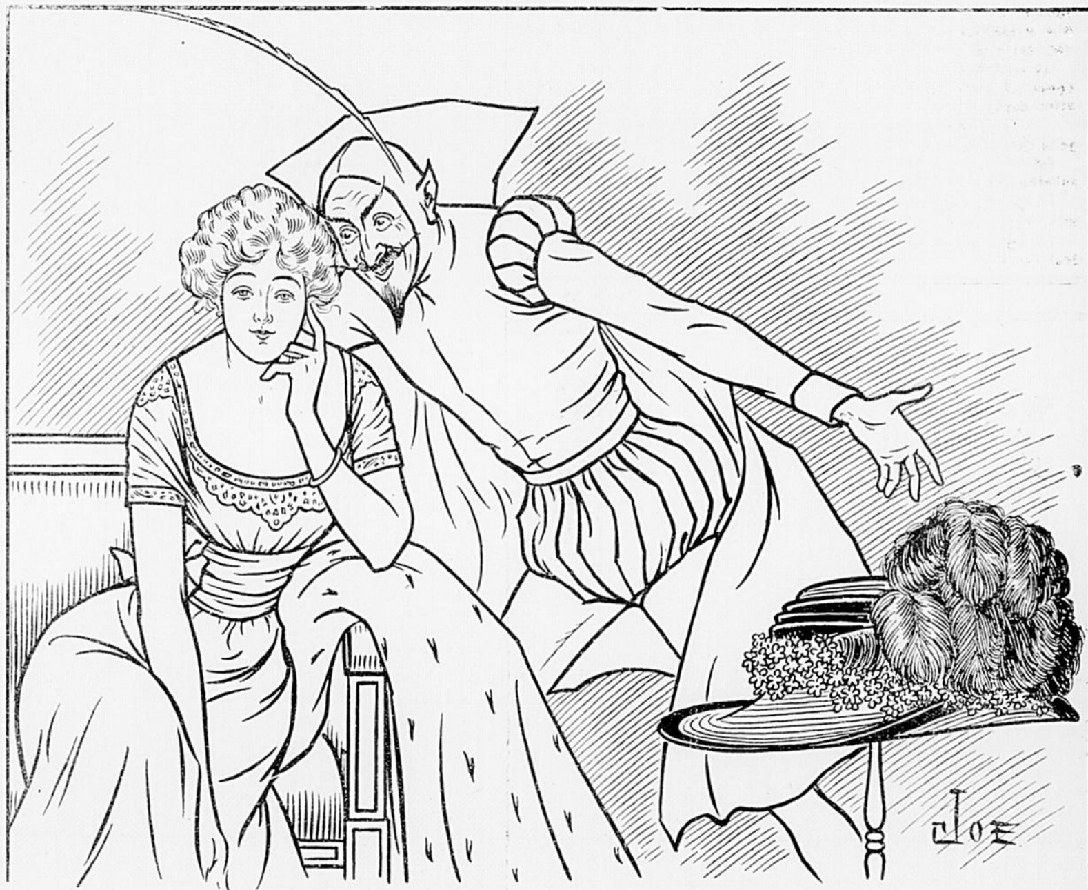
LE DEMON DE L'ORGUEUIL.—Avec ce chapeau tu seras plus belle !