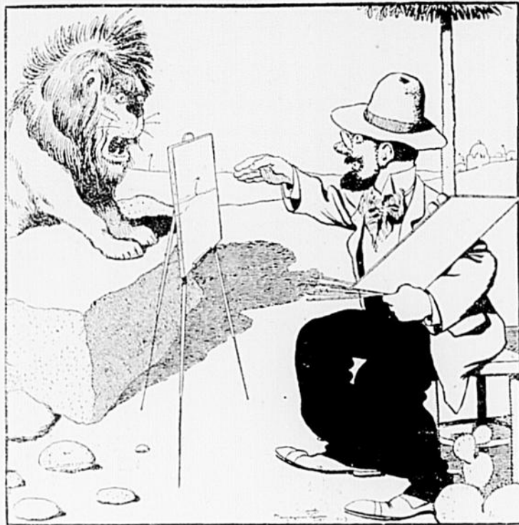
Le peintre. — Inutile d'insister... je ne fais pas le portrait!...