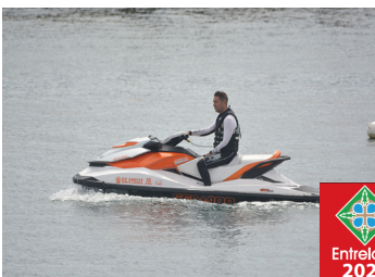
Moteur type in-board

À chaque mise à l'eau, effectuer une déclaration de mise à l'eau, auprès de la Municipalité et utiliser un débarcadère public ou privé enregistré et identifié par la lettre D suivie de trois chiffres.