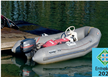
Moteur 1 à 25 forces