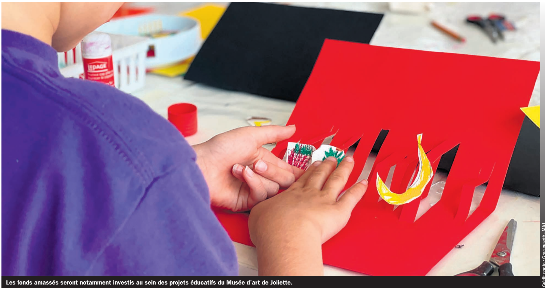
Les fonds amassés seront notamment investis au sein des projets éducatifs du Musée d'art de Joliette.