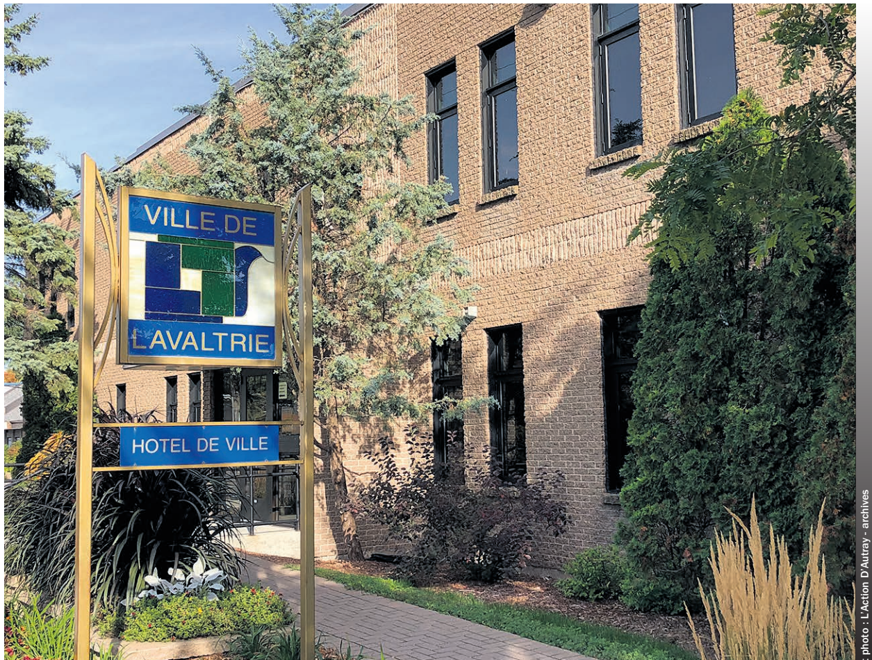
L'hôtel de ville de Lavaltrie deviendra un lieu d'accueil sécuritaire pour tous.