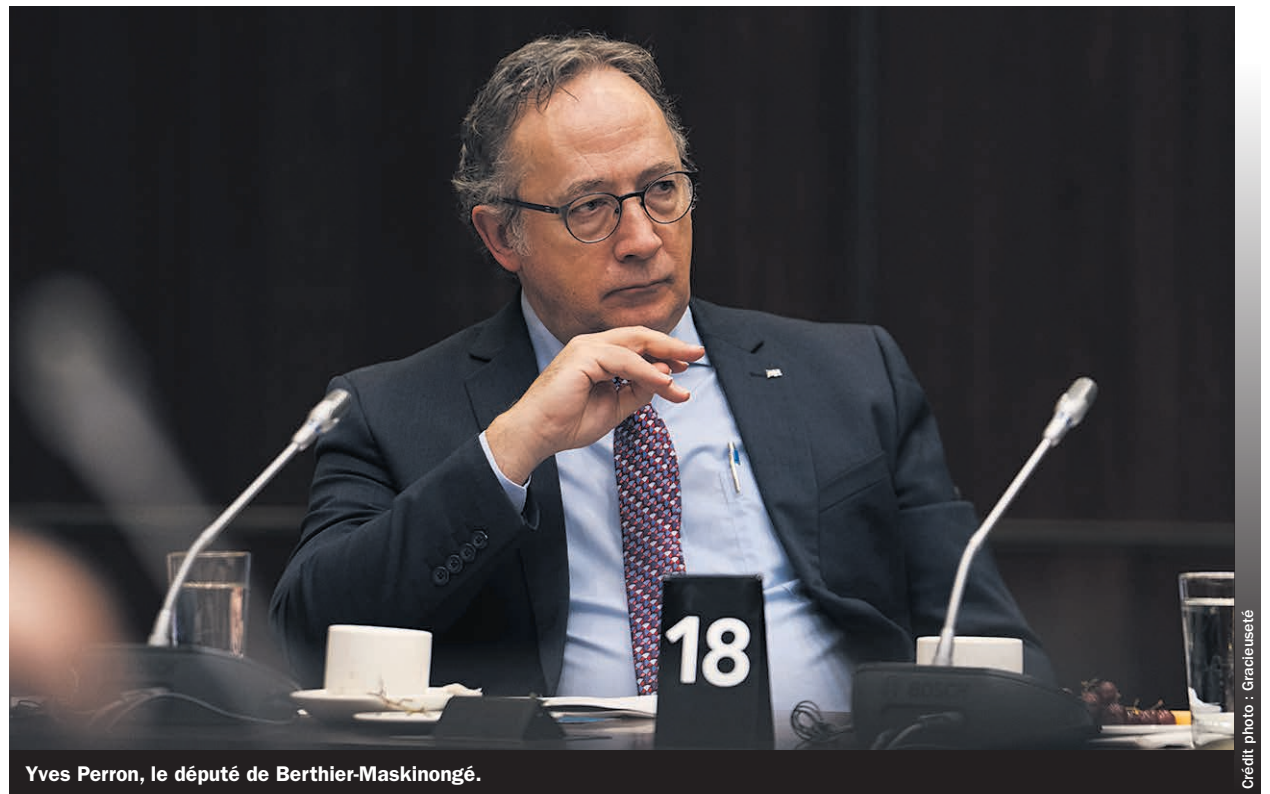
Yves Perron, le député de Berthier-Maskinongé.