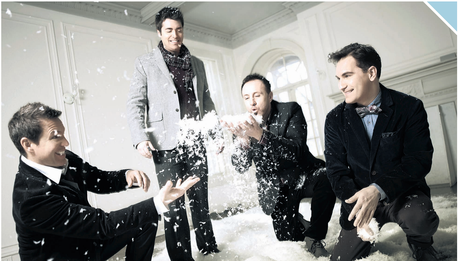
Le concert mettra en vedette Tocadoéo et l'Orchestre symphonique des jeunes de Joliette.