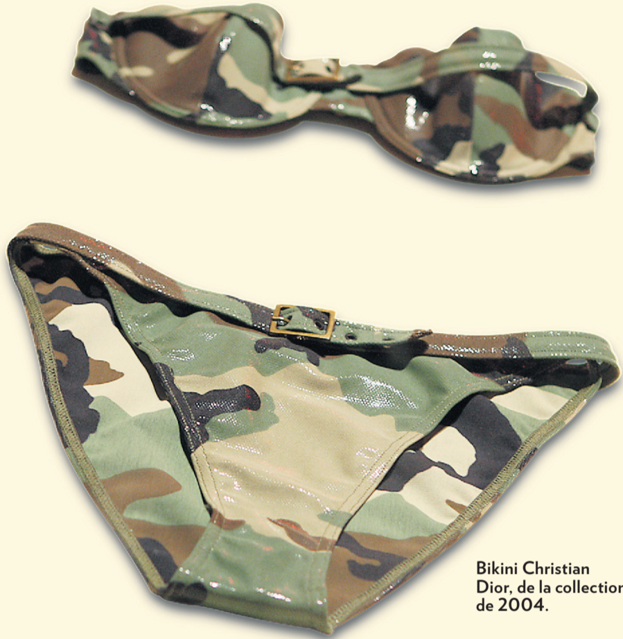
Bikini Christian Dior, de la collection de 2004.

Le camouflage acquiert ici une symbolique anti-guerre, qui est ensuite adoptée par les groupes punk puis hip-hop, lesquels étendent la portée du message, désormais anti-élite, anti-establishment, rebelle, même, ironie suprême, anti-militaire. Le musée expose d'ailleurs un digne représentant de cette époque: le pantalon tiger stripe (motif de l'armée américaine au Vietnam) de Joe Strummer, le guitariste du groupe punk The Clash.