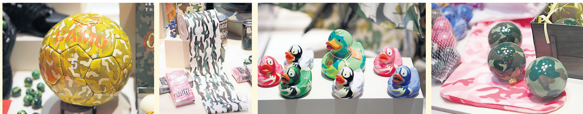
Ballons de soccer, papier hygiénique, balles de billard, toutous, même des accessoires pour le bain: le motif camouflage est décidément partout.