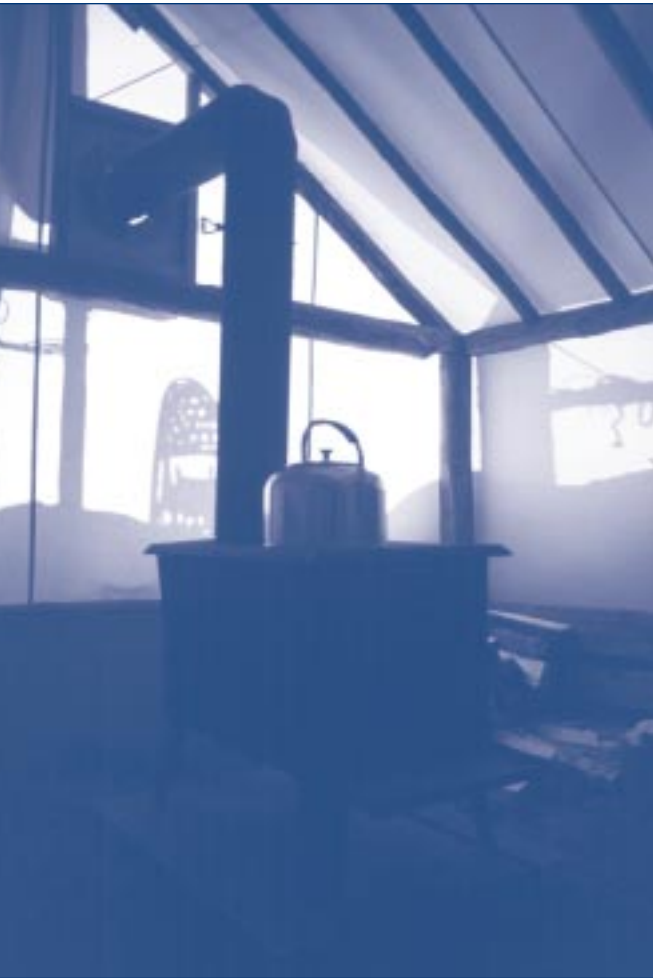
Gilles Chagnel, STAQ

Les 54 communautés autochtones ont une richesse culturelle indéniable. Ici, l'immersion en milieu montagnais.