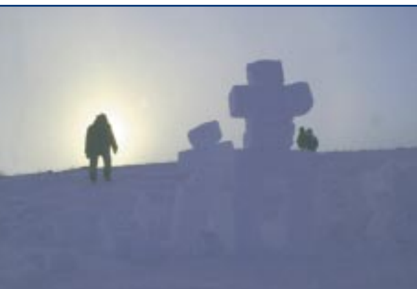
Louise Séguin, Tourisme Québec

Les sculptures de neige inuites ont de quoi impressionner les touristes.