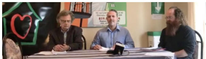
Image tirée de la vidéo du Facebook live