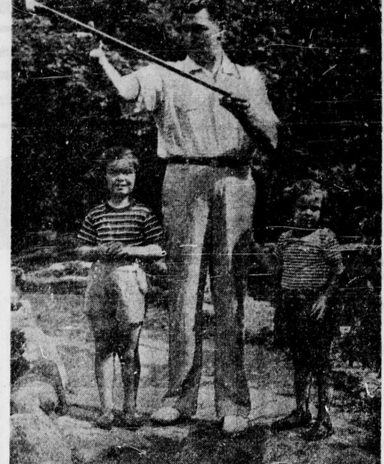
JACK DEMPSEY, ancien champion du monde poids-lourd, lance au loin la canne qui le guida durant tout le temps de sa convalescence.