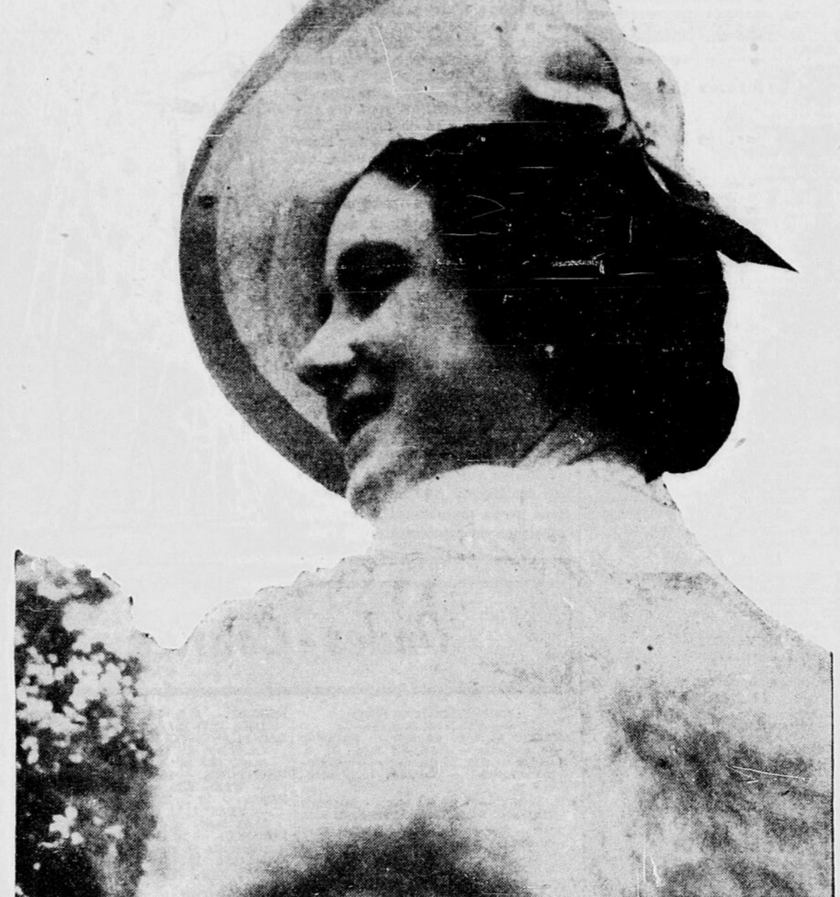
Sa Majesté la reine Elisabeth compte aujourd'hui 39 ans. A cette occasion, elle reçoit les vœux de toutes les parties de l'Empire britannique. A Ottawa, on a tiré vingt et un coups de canon pour marquer cet heureux anniversaire.

Sur le Georgic, via New-York, fermeture à 3 h. 20 du soir, le 4 août. Sur l'Empress of France, via New-York, fermeture à 10 h. 30 du soir, le 6 août. Sur le Queen Mary, via New-York, fermeture à 3 h. 20 du soir, le 8 août. Sur le Lady Nelson, via Halifax, pour la Jamaïque, etc., fermeture à 10 h. 30 du soir, le 8 août. Sur le Duchess of York, via Montréal, fermeture à 10 h. 30 du soir, le 8 août. Sur l'Empress of Britain, via Québec, fermeture à 10 h. 30 du soir, le 11 août. Courrier aérien Via Shediac, fermeture à 11 h. 15 du matin, le 4 août. Via Acadia, fermeture à 5 h. 30 du soir, le 8 août. Via Montréal, fermeture à 5 h. 45 du soir, le 9 août. Via Shediac, fermeture à 11 h. 15 du matin, le 11 août.