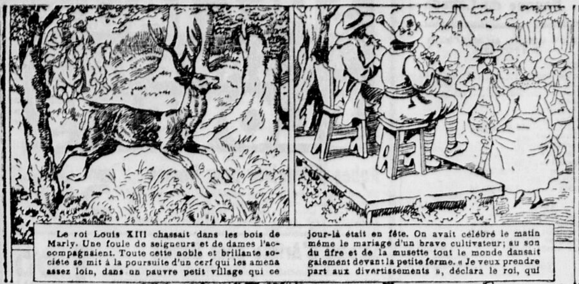
Le roi Louis XIII chassait dans les bois de Marly. Une foule de seigneurs et de dames l'accompagnaient. Toute cette noble et brillante société se mit à la poursuite d'un cerf qui les amena assez loin, dans un pauvre petit village qui ce

jour-là était en fête. On avait célébré le mariage même le mariage d'un brave cultivateur; au son du fifre et de la musette tout le monde dansait gaiement devant la petite ferme. Je veux prendre part aux divertissements », déclara le roi, qui