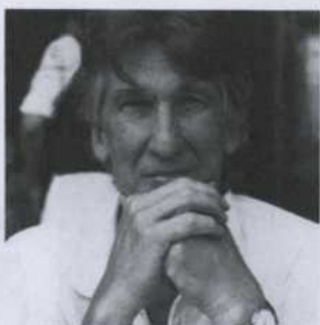
Charles L. Mee