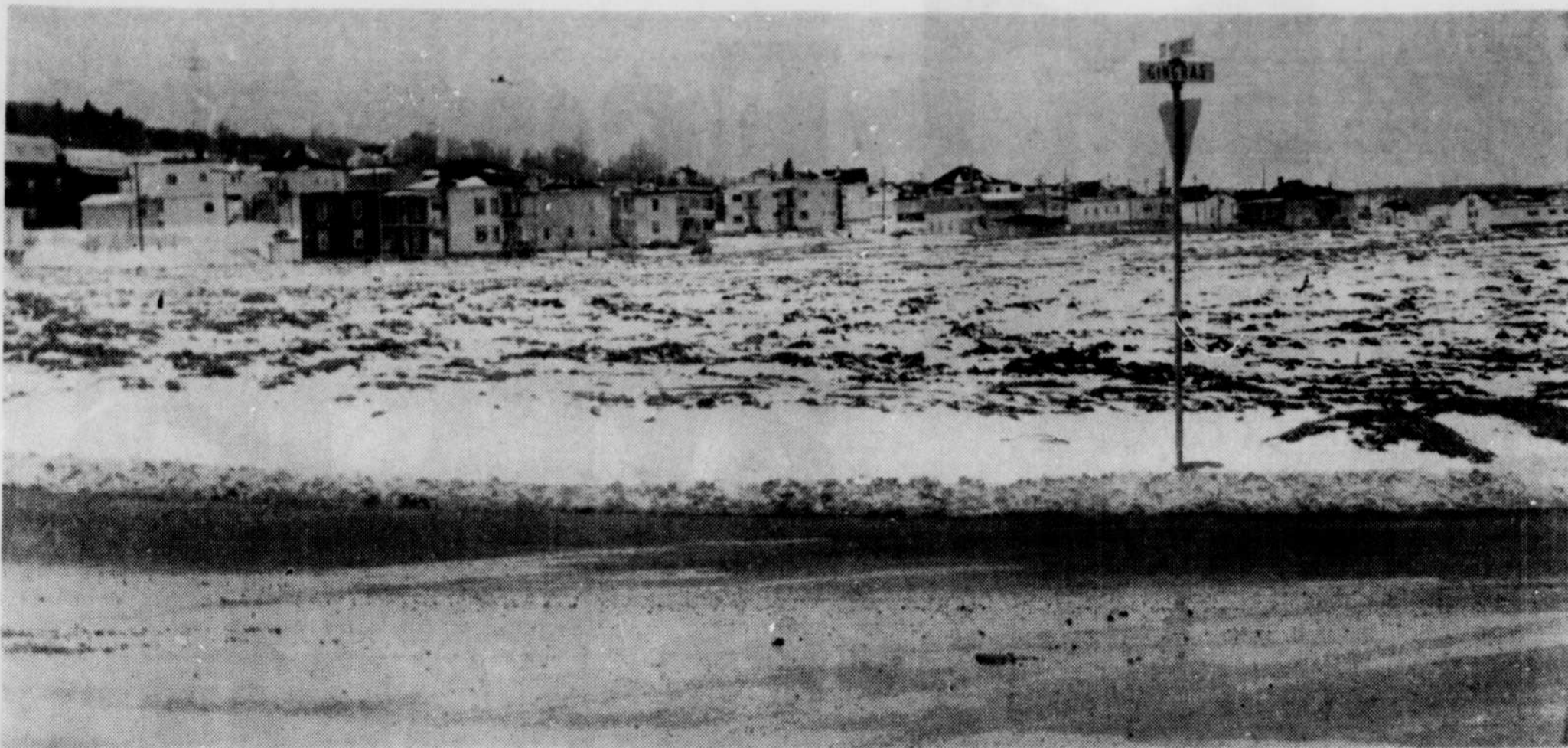
Le chantier du nouveau St-Maurice est sur le point d'être fermé pour l'hiver. Il reste encore quelques travaux mineurs à effectuer le printemps prochain.