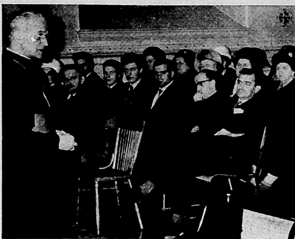
Son Excellence Mgr Arthur Douville, évêque de Saint-Hyacinthe, a livré quelques-unes de ses impressions sur le concile oecuménique au cours d'une rencontre avec les dirigeants de l'Action catholique, de l'Action sociale et de l'Apostolat laïque. L'évêque de Saint-Hyacinthe a profité de l'occasion pour présenter ses souhaits et ses vœux de bonne année.

Un fusil automatique (FN) a été volé le soir de Noël dans les magasins de la Compagnie B du 6 e Bataillon du Royal 22 e Régiment, montée des Trente, à Saint-Hilaire. Les voleurs sont pénétrés dans le manège militaire de Saint-Hilaire après avoir coupé la grille d'une fenêtre. Les apaches ont ensuite défoncé les portes des magasins à armes avec une hache à incendie. La Sûreté provinciale et la police municipale ont aussitôt institué une enquête dans le but de capturer les voleurs, qui pourraient se servir du fusil (FN) pour des motifs aucunement militaires.