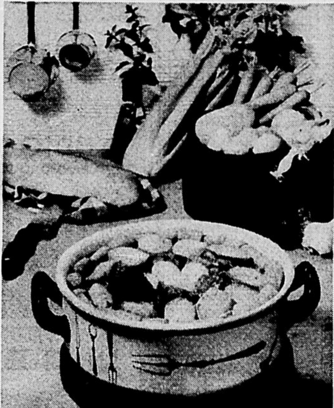
A cette période où tous désirent oublier la dinde et les poulets qu'ils ont dégustés durant cette quinzaine de festivités, la cuisinière sera certainement fort appréciée si elle présente un plat qui fait songer à l'été. Une casserole de pommes de terre, de tomates et de fromage servie avec des pains chauds sera bien vue par toute la famille.

le jour à PR. 4-5316 le soir à PR. 4-7192 à Granby FR. 2-7809 à Upton 42 s. 2.