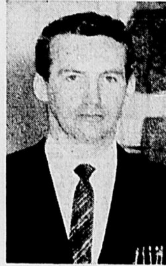
Albany Tétrault, maire de La Providence

M. Albany Tétrault, maire de La Providence, est heureux d'offrir à tous ses concitoyens et amis, ses vœux sincères de BONHEUR, SANTE, PROSPERITE, à l'occasion de la Nouvelle ANNEE.