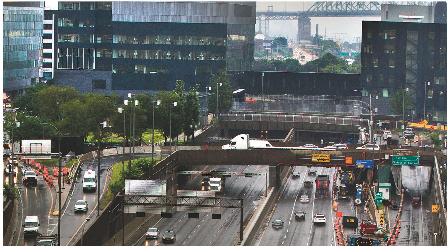
Selon les évaluations préliminaires de la Ville, il en coûtera « entre 45 et 70 millions » de dollars pour recouvrir 125 mètres d'autoroute entre les rues Sanguinet et Hôtel-de-Ville.