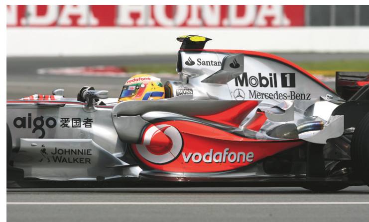
Les pays investissent souvent des millions pour accueillir des événements sportifs.

Le Grand Prix de Formule 1, dont le cirque s'arrêtera de nouveau à Montréal en juin, est de la même école. Entre autres affaires financières et de corruption, son grand patron,