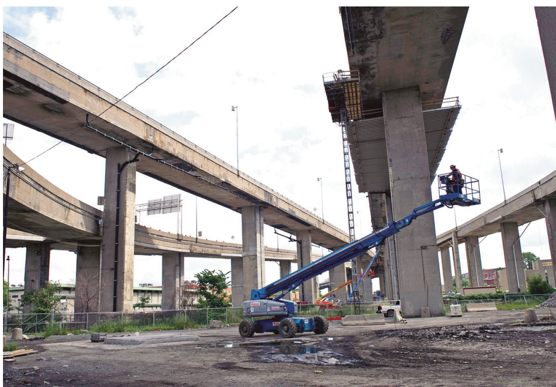
Les coûts de reconstruction du complexe Turcot sont évalués à 3,7 milliards.

Aux bouchons de circulation dans le quartier s'ajoutent des inquiétudes quant à la qualité de l'air et la sécurité des piétons, notam-