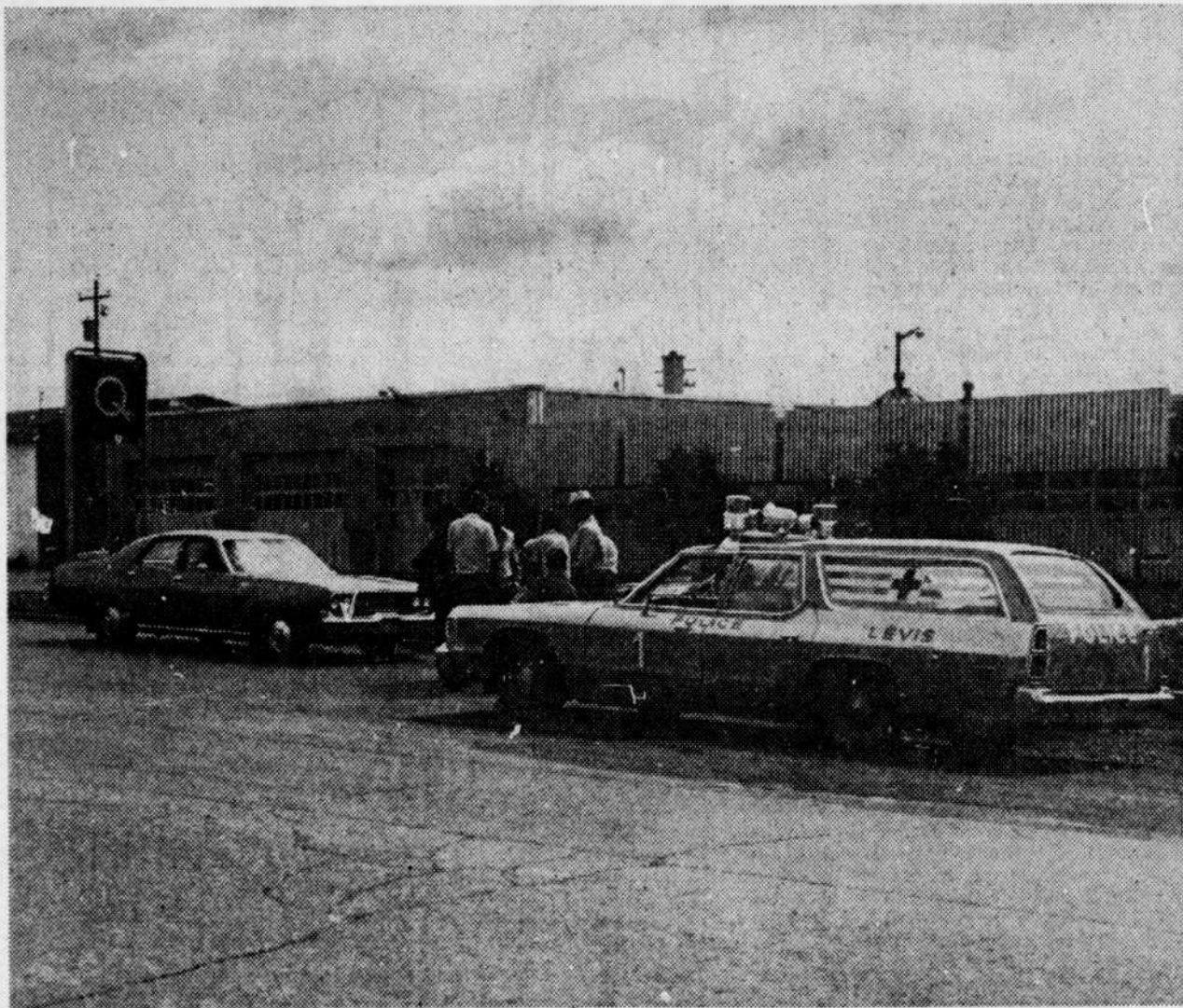
La surveillance policière a été constante, hier, devant les bureaux de l'Hydro-Québec, à Lévis et à Saint-Joseph de Beauce. Dans cette dernière ville, le nombre de manifestants s'est élevé à près de 600, le matin. Avant comme après leur arrivée, les policiers étaient en place, craignant des troubles à la suite de pannes d'électricité prolongées.

Grève ou pas, quand vient le moment de payer, le consommateur n'est pas oublié!