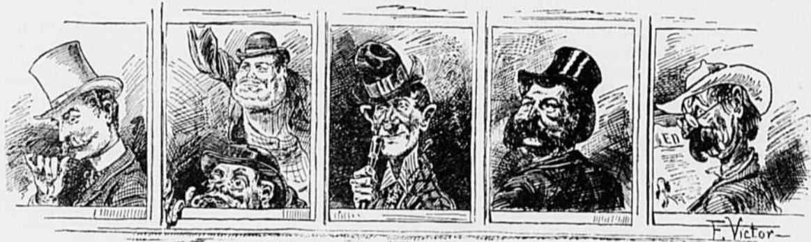
IV Lorsqu'elle descend. "—Il est temps que le peuple prenne en main l'arrosage de nos rues. Voyez donc !"