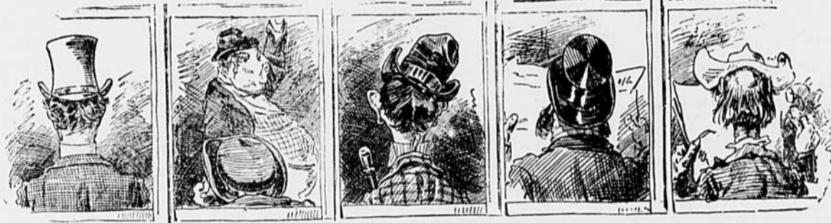
III Les chars vus du dehors tant qu'elle y est. "—Après tout, il n'y a rien dans les journaux."