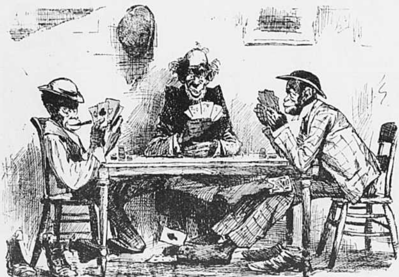
Père Sambo.—C'est un plaisir de jouer au poker avec des gentlemen qui sont assez honorables pour se tenir les mains sur la table.