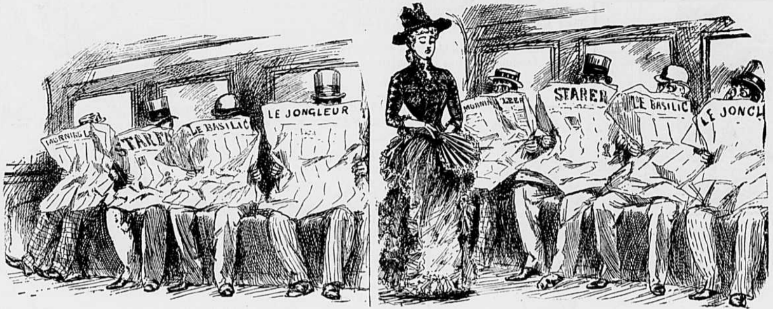
I Les nouvelles, ce matin, sont des plus absorbantes.