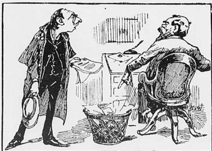
CANDIDAT entrant dans le bureau de son journal favori.— J'ai cru que je devais vous apporter d'abord mon adresse aux électeurs. La voici.

Le Rédacteur.—Très-bien, monsieur. Comme j'ai le rhumatisme, veuillez donc la jeter vous-même dans le panier aux oubliettes.