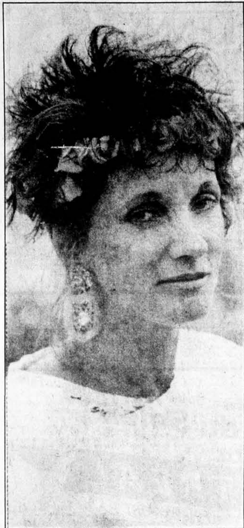
Il faut continuer...