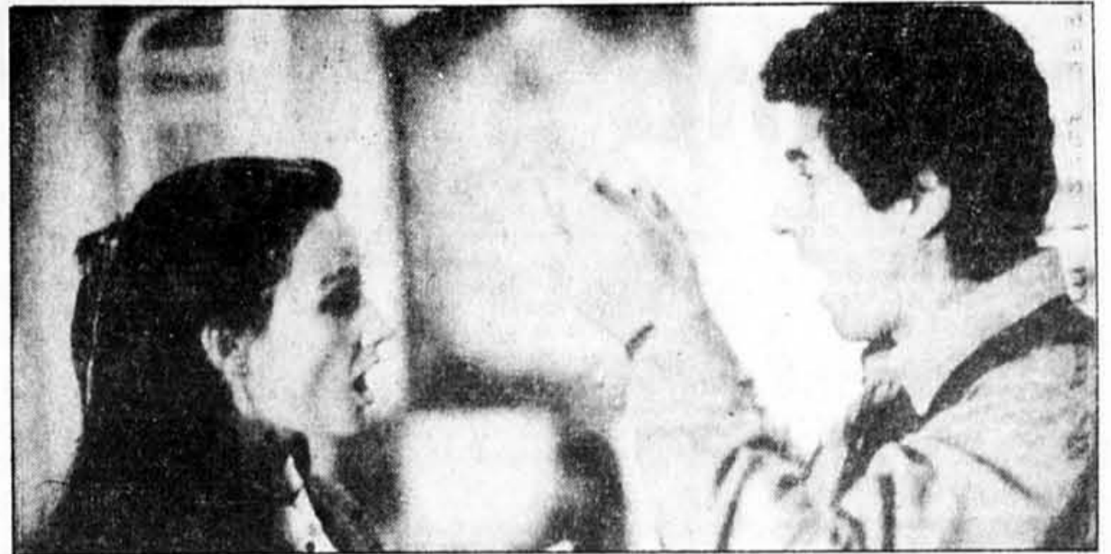
« Partir revenir », de Claude Lelouch.