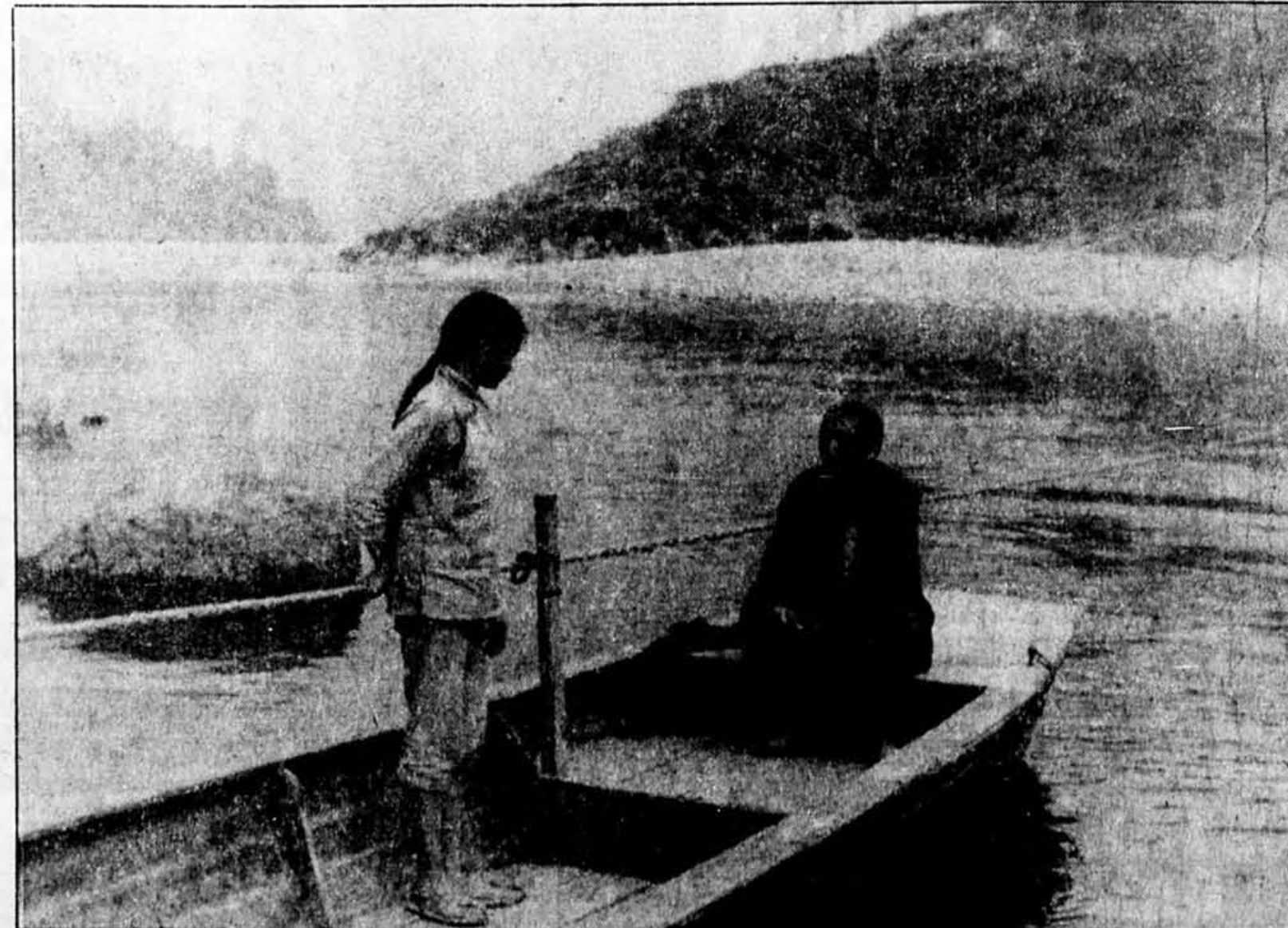
«Border Town», un film chinois de 1984.

Un cours d'un attentat contre un magistrat, Laura, une jeune terroriste, «exécute» aussi un membre de son commando. C'est le début d'une histoire de femmes: Maria et Rosa, la mère et la sœur du terroriste tué; Gina, la vieille nounou de Laura; Marta, sa mère, et Renata, une de ses amies; et enfin Giuliana, le magistrat devant lequel la terroriste dévoilera son secret. Et Laura sera le «fil rouge» qui reliera les histoires personnelles de chacune.