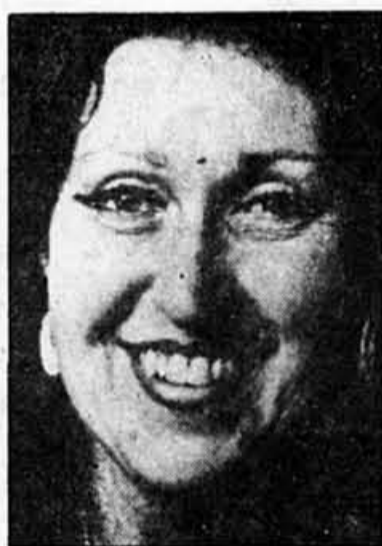
Ida Haendel: 55 minutes de violon.

deuxième Concerto pour violon de Pettersson diffère assez de ce qu'apportent les concertos du répertoire traditionnel. Le Beethoven, par exemple, est un grand classique, une sorte de monolithe. Le Bartok (je parle, bien sûr, de Numéro 2) est un chef-d'oeuvre de séduction sonore; le Tchaïkovsky, le Mendelssohn et le Bruch (le Sol mineur) sont des oeuvres irrésistibles, faciles à écouter.