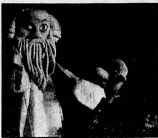
Le Soldat et la mort : à partir d'aujourd'hui à la Maison de la culture du Plateau Mont-Royal.

À l'extérieur, et gratuitement, animation des trapézistes