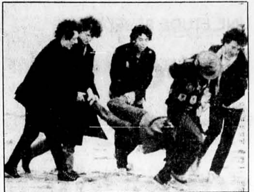
« Le thé au harem d'Archimède ».

Comme par les années passées, le FFM offre une telle variété et une telle abondance de films qu'il serait surprenant qu'on n'y trouve pas ce qu'on y cherche. Quant aux chefs-d'œuvre, c'est une autre affaire.