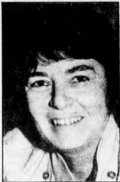
Nicole Brossard