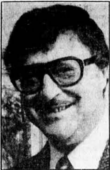
Roger Lemelin