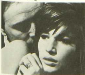
Le Désert rouge