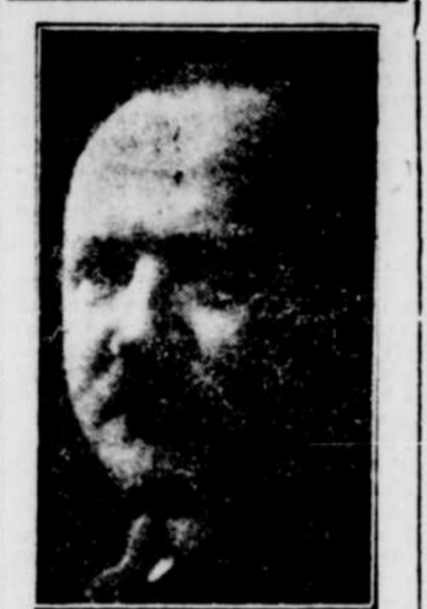
L'honorable Ernest Lapointe qui a été le principal chef de l'opposition dans le dernier vote pris aux communes.

Dans un mémoire au parlement, le premier ministre dénonce les attaques faites contre Lord Byng de Vimy