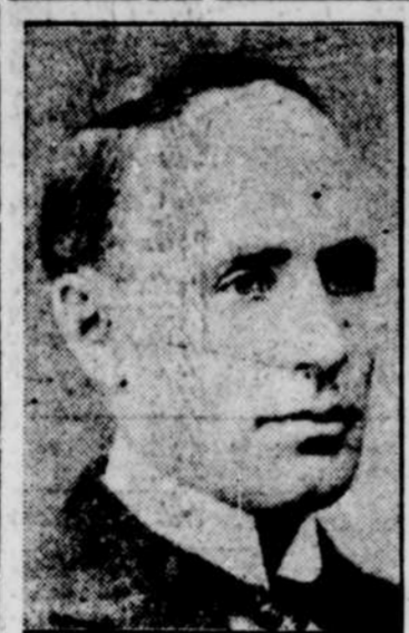
Le très honorable Arthur Meighen dont le gouvernement a été battu après n'avoir été au pouvoir que durant trois jours.