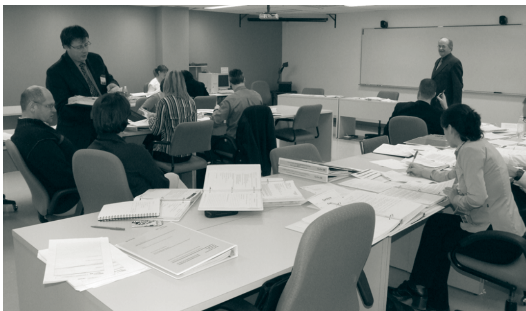
Les enquêteurs du MDDEP effectuent des travaux dans le cadre de la formation Processus d'enquête en matière d'infractions environnementales offerte à l'École nationale de police du Québec.