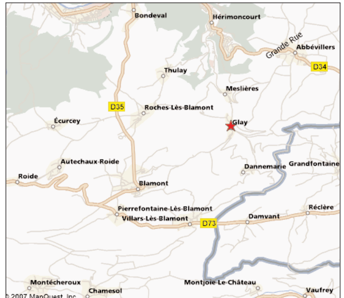
En Franche-Comté, dans le Doubs, autour de Glay, commune de Meslières.

Il importe de dire un mot du fondateur de l'Institut de Glay et de son épouse car leurs itinéraires éclairent la formation de l'Institut et l'approche formatrice dont ils le dotèrent.