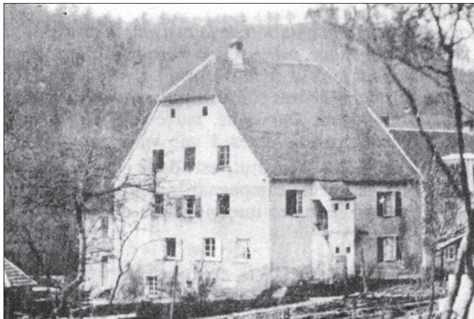
Le manoir de l'Institut de Glay (1826)