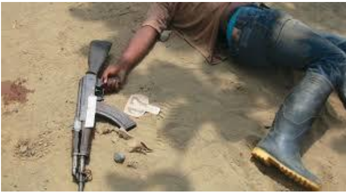
'Falsos positivos' aumentaron más del 150 % con Uribe 7

En novembre 2012, le Bureau a publié un Rapport sur la situation en Colombie, qui identifiait cinq aspects méritant une attention particulière : « i) le suivi du cadre juridique pour la paix et de l'évolution législative y afférente, ainsi que les aspects liés à la compétence relative à l'émergence de « nouveaux groupes armés illégaux »; ii) les poursuites liées au développement et à l'essor des groupes paramilitaires; iii) les poursuites liées au déplacement forcé de population; iv) les poursuites liées aux crimes sexuels; et v) les affaires dites de « faux positifs ». 6