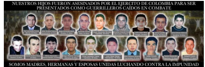
Images des citoyens passés pour guerrilleros Carta de Las Madres de Soacha al presidente Santos 21

dans le département du Norte de Santander. D'autres cas ont ensuite été découverts dans les départements d'Antioquia, Boyacá, Huila, Valle del Cauca et Sucre. 20