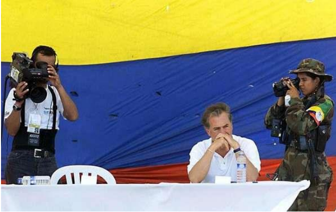
Ex-président M. Andres Pastrana Arango (1998-2002), lors du rendez-vous échoué avec M. Manuel Marulanda Velez « Tirofijo », dans le cadre des négociations de paix 9 .

Ainsi, la Colombie a élu comme Président Alvaro Uribe grâce à un programme politique de « sécurité démocratique ». Alvaro Uribe est l'ancien gouverneur d'Antioquia, une des plus puissantes régions économiques de la Colombie, qui, durant son mandat comme gouverneur, avait comme stratégie politique de lutter contre la subversion et les guérillas. Pour atteindre cet objectif dans ce département, il a donc créé des forces paramilitaires urbaines appelées « CONVIVIR » et un réseau d'informateurs civils payés par récompense.