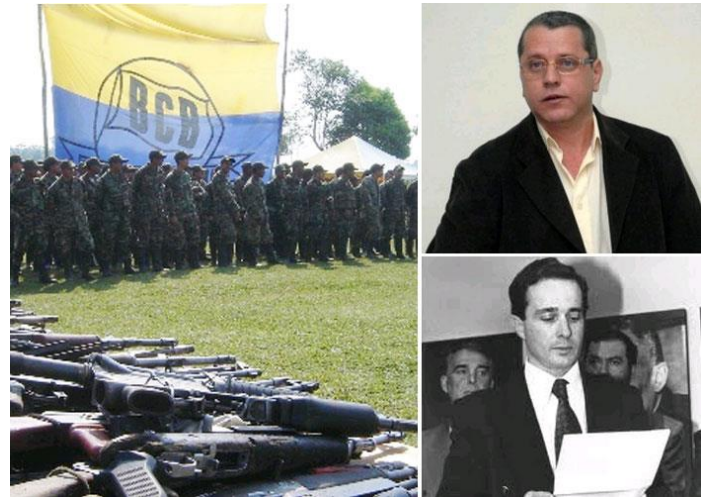
Source : Article "Las Convivir que se volvieron organizaciones paramilitares M. jefe paramilitar Hebert Veloza García alias "HH", Organisations paramilitaires issues des organisations citoyennes armées nommées CONVIVIR, créés par M. Uribe Velez, lors de sa période comme gouverneur du département d'Antioquia,

démobilisations de groupes armés 13 , subventions aux groupes économiques sous prétexte d'aide aux paysans 14 , utilisation de l'emblème de la Croix Rouge pour cacher des opérations militaires 15 , violations territoriales des pays voisins, 16 etc.