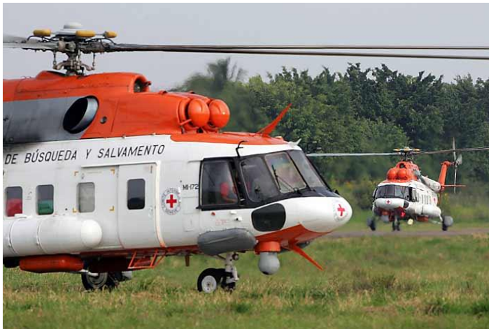
Hélicoptère opération Jaque 3

faux positifs ». À proprement parler, ce suivi sera fait au moyen d'une description du contexte et des faits avérés, de l'interprétation des références normatives et politiques liées à ces faits, certains éléments de preuve qui démontreraient une responsabilité subjective selon la théorie de la responsabilité du supérieur hiérarchique, entre autres aspects, concernant l'application du Statut de Rome à la situation particulière des « faux positifs ».