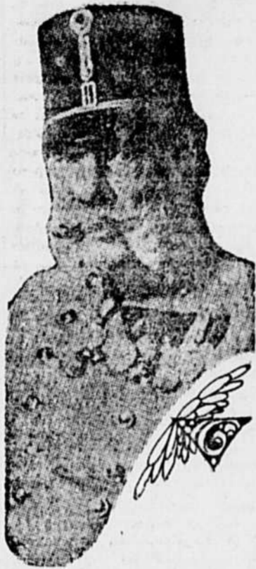
L'Empereur François-Joseph, décédé hier soir

François-Joseph est le plus titré des souverains d'Europe. C'est pure modestie lorsque, parlant de son empire, il l'appelait la Double-Monarchie, car il n'était rien de moins, par la grâce de Dieu, qu'empereur d'Autriche, roi apostolique de Hongrie, roi de Bohême, de Dalmatie, de Croatie, d'Esclavonie, de Galicie, de Lodomérie et d'Illyrie, roi de Jérusalem, archiduc d'Autriche, grand-duc de Toscane et de Cracovie, duc de Lorraine, de Salzbourg, de Styrie, de Carinthie, de Carniole et de Bukovine, grand prince de Transylvanie, margrave de Moravie, duc de la Haute-Silésie et de la Basse-Silésie, duc de Modène, de Parme, de Plaisance et de Guastalla, duc d'Auschwitz, de Zator, de Terchen, de Frioul, de Raguse et de Zara, comte princier de Habsbourg et du Tyrol, de Uybourg, Goritz et Gradisca, prince de Trente et de Brixen, margrave de la Haute et de la Basse-Lusace et en Istrie, comte de Hohenembs, Feldkirch, Brigance et Sonnenberg, seigneur de Trieste, de Cattaro et de la Marche Wende, grand voïvode de la voïvodie de Serbie.