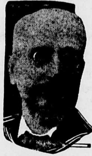
VENIZELOS, qui vient de déclarer la guerre à l'Allemagne et à la Bulgarie.

"Le gouvernement provisoire a aussi déclaré la guerre à l'Allemagne, parce qu'elle coule des vaisseaux portant des troupes nationales, et des partisans du gouvernement provisoire."