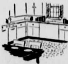
ou moderniser votre maison

... causez avec votre gérant de banque qui vous dira quels sont ses nouveaux pouvoirs aux termes de la Loi sur les prêts pour l'amélioration des fermes.