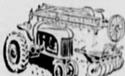
ou acheter de nouvelles machines