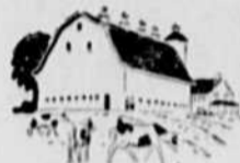
Si vous voulez bâtir une étable moderne