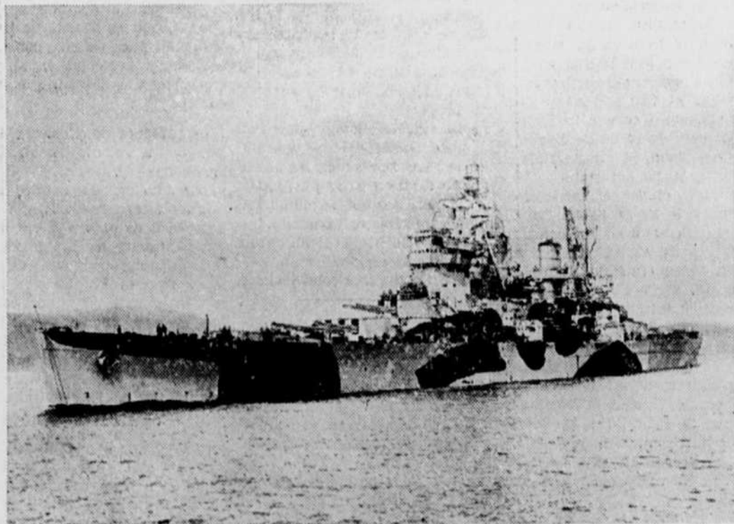
La photo montre le cuirassé britannique "ANSON" qui avec les navires "le Howe et le Duke of York furent mis en chantier en 1937. Il est armé de dix canons de quatorze pouces, de seize canons 5.25" et de différents canons de plus petit calibre.