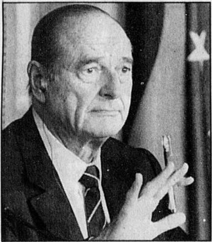
Le président Jacques Chirac

Jacques Chirac, soutenu par l'Allemagne, l'Espagne, la Belgique, le Luxembourg la Suède et le Danemark, rejette notamment le principe du pays d'origine, qui permettrait à un prestataire de services d'aller travailler dans un autre Etat membre tout en conservant la réglementation sociale de son pays. Paris y voit une grave menace de dumping social. La France exige en outre que les services publics, les professions réglementées et la culture ne soient pas concernés par la directive.