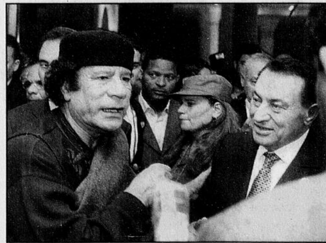
Au nombre des chefs d'État arabes présents au sommet, on remarquait Mouammar Kadhafi, de Lybie, à gauche, en compagnie de Hosni Mubarak, d'Égypte.

ALGER (AP) - Israël ne doit pas s'attendre à une normalisation de ses relations avec les pays arabes «sans rien en retour». En ouverture du sommet de la Ligue arabe à Alger, le secrétaire général de l'organisation, Amr Moussa, a réaffirmé hier que l'État hébreu devrait également faire des concessions.