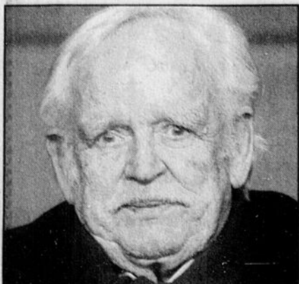
Le prince Rainier III

Rainier a accédé au trône monégasque le 9 mai 1949, après la disparition de son grand-père, le prince Louis II. Il a eu trois enfants de son mariage avec l'actrice américaine Grace Kelly: Caroline, Albert et Stéphanie.