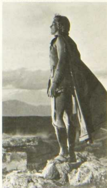
Alexandre le Grand

La critique fut assez sévère pour le film de Rossen et trouve que le cinéaste n'a pas tout à fait réussi à trouver l'authenticité qu'il cherchait et que les personnages manquent de vie. Il reste que la peinture des moeurs et des costumes de l'époque ne manque pas d'intérêt.