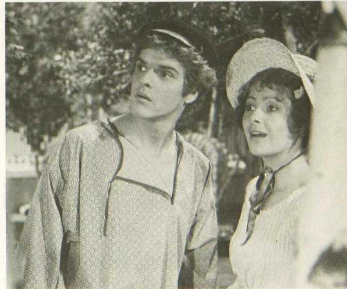
«Il est un peu délicat... Faites-en un garçon agile et adroit»