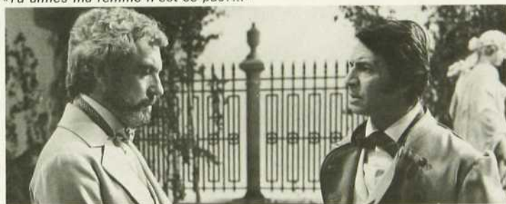
«Il vous faut persuader Vera en personne...»