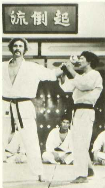
La Fureur de vaincre

La critique a jugé que ce film de Bruce Lee fait bonne figure dans la vague de productions centrées sur les arts martiaux qui déferle de Hong Kong. Pour les admirateurs de Bruce Lee, c'est un régal. Ils verront un bel athlète dans des combats bien réglés.