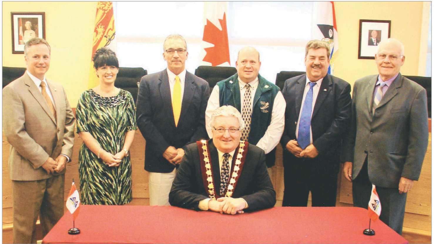
Le conseil municipal de Campbellton.

« Le plus gros du travail a été effectué par le département des travaux publics de la municipalité. Nous avons l'équipement et un personnel compétent, alors ça nous a permis d'effectuer des économies importantes », explique le maire. Le demi-million économisé sera