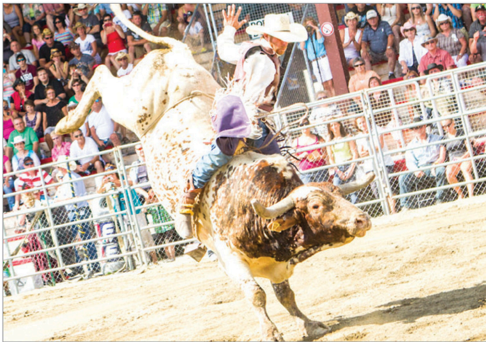
Quelque 65 000 personnes sont passées aux guichets du Festival Western de Saint-Quentin l'année dernière.