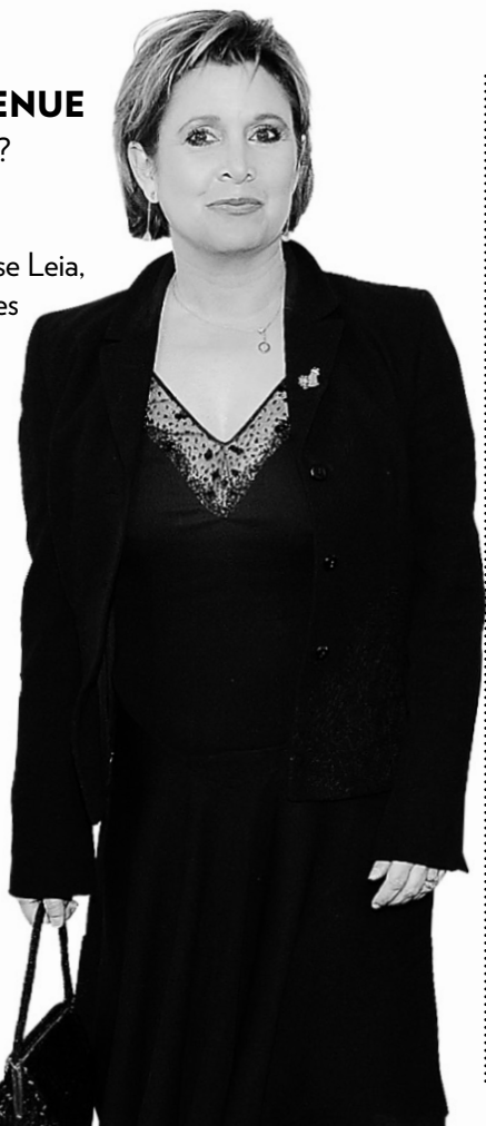
Carrie Fisher

L'interprète de la princesse Leia, dans Star Wars , n'a plus les cheveux en brioches de carême. En contrepartie, oui, elle tourne encore des films. L'œil averti l'aura d'ailleurs reconnue en mère supérieure dans Charlie's Angels: Full Throttle ainsi qu'en soeur (remarquez le casting) dans Jay and Silent Bob Strike Back . Et donnez-vous deux morceaux de robot si vous vous souveniez de son rôle de soutien (Marie) dans When Harry Met Sally .