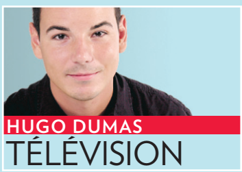
HUGO DUMAS TÉLÉVISION

Les critiques envers les nouvelles émissions estivales de Radio-Canada ne proviennent pas que de l'extérieur. Certaines salves contre En attendant ben Laden et Tout le monde tout nu ont été également tirées sur les ondes de la radio de Radio-Canada (95,1 FM), ce qui n'a pas plu aux patrons de la télévision.