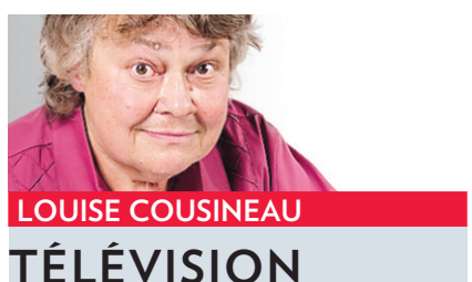
LOUISE COUSINEAU TÉLÉVISION

Les cêlinophiles n'apprendront pas grand-chose de neuf quand ils regarderont vendredi à 20 h la biographie consacrée à Céline Dion à la chaîne américaine A&E. Mais comme les enfants redemandent toujours le même conte le soir, voilà un documentaire qui se laisse regarder avec plaisir. Quand on aime, on a toujours le goût de retrouver mille fois la même histoire.