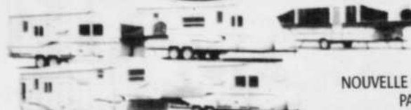
NOUVELLE SÉRIE DE PALOMINO redessinée par Forest River