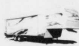
SIERRA structure d'aluminium