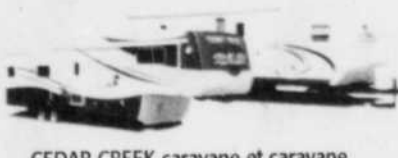
CEAR CREEK caravane et caravane à sellette luxueuse 4 saisons