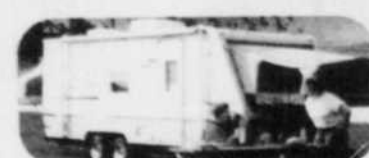
La luxueuse ANTIQUA de STARCRAFT