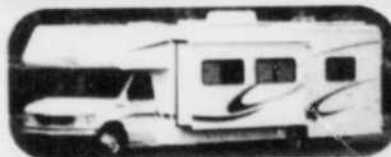
SUNSEEKER et FORESTER 4 saisons