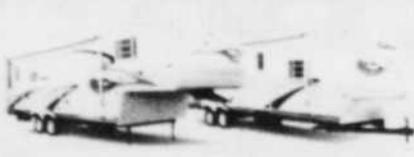
SALEM et SALEM LE pour tous les budgets