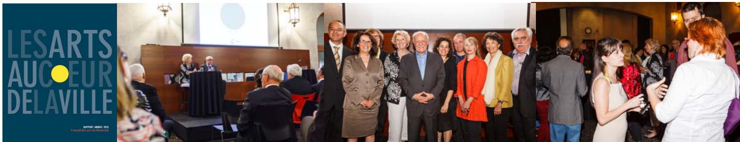
Le Rapport annuel 2012 Les arts au coeur de la Ville et les participants à la rencontre annuelle.