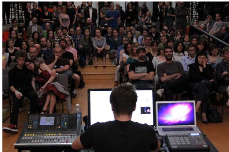
(GR)ONDES, une performance audio d'Étienne Grenier à l'Écomusée du Fier Monde.

De janvier à mars 2013, l'artiste a effectué une série d'interventions artistiques dans cette école exposant ainsi les élèves à son processus créatif et en se nourrissant de leurs apports pour élaborer sa propre création. Cette série d'infiltrations technologiques déployées par Étienne Grenier et les élèves avait pour but de détourner de leur fonction première certains appareils, comme l'interphone et la cloche, normalement utilisés pour faire respecter des mesures disciplinaires à l'intérieur de l'école. L'ensemble des enregistrements réalisé avec l'aide des jeunes a ensuite servi de base à la création d'une œuvre audio. Une présentation des compositions sonores des élèves était également au programme. Le programme Libres comme l'art est une initiative du Conseil des arts de Montréal (CAM), de la Conférence régionale des élus de Montréal (CRÉ) et du ministère de l'Éducation, du Loisir et du Sport (Programme de soutien à l'école montréalaise).