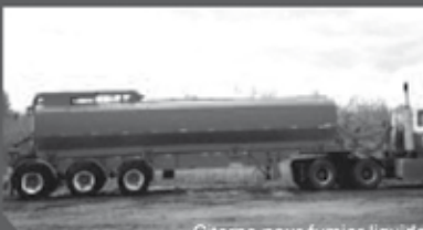
Citerne pour fumier liquide