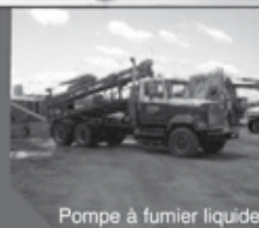
Pompe à fumier liquide