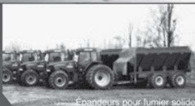
Épandeurs pour fumier solide